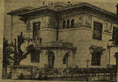
Kuća Maksima Gorkog

nam ostvarenima, i tu sinizai života i umjetnosti Gorki je venično postojao u izražaju tih ostvarenja. On je bio prvi u avangardi proleterskih pisaca i umjetnika, koji je svojom proletarijat kao glavnom likom, kao najveću vrijednost u svoja djela, on je kroz za djela istakao, gotovo otkrio pred čitavom svjetskom javnosti, koliko neiscrpne snage, materijne i fizičke, koliko mudrosti i ličnosti posjeduje proletarijat. Uporedo sa razvojem ruskoj revolucionarnog pokreta, sa revolucionarnim radom Lenjina i ostalih revolucionara Gorki, književni glasnik Lenjina, stvarao novu epohu u ruskoj i svjetskoj litera-