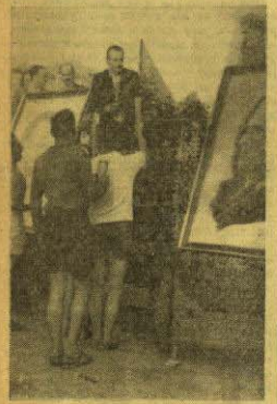
У понедељак 19 маја прошла је штафета кроз Баниа Луку...

плана. Преко Босанског Петровца, Бићке, Крпаче, Прједора, Баниа Луке штафета је свакодневно одицала до очекивана свуда манифестационог гласа дана и селска која су тражила кретање штафете поздрављачи Титу.