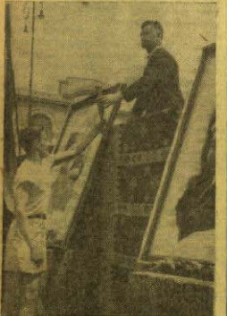
и сутрадан преко Јајца наставила пут

Прозак штафете испод Козаре, поприште тежих и славних борби претворио се у велико народно veselje и miting. Штафета је заустављена окупилу се сељаци из многих околних села и омладина се, заједно са носиоцима штафете