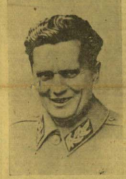
Za našu poljoprivredu mi moramo prema planu imati u 1951 godini nekoliko hiljada traktora više no što imamo danas, da seljaci mogu obraditi zemlju. A gdje ćemo ih uzeti? Razumije se moramo ih izraditi u novim fabrikama. Mi moramo 1951 godine imati preko dva puta više traktorskih plitova no što imamo danas, oko 240.000 sprečnih plitova više no što imamo danas, preko 60.000 više seljaka, više preko 2.500 žetelica, više oko 8.000 samovežalica, više oko 220 kombaina, više oko 7.000 kosilica, više oko 7.000 vrsalica, više oko 14.000 triera, više oko 70.000 sječkalica i tako dalje. Prema tome se vidi koliko ogromni zadatak ima petogodišnji plan za naše seljštvo...

Prvo, mi ćemo morati učiniti najveće napore da stvorimo potrebne stručne kadrove i odgojno obrazovne snagu za našu industriju i privredu vođa, kole će se prema planu silno razvijati. U toku ovih pet godina naša će industrija trebati novih, 170.000 industrijskih radnika, koji moraju da se upoznaju sa savremenim procesom proizvodnje. Znači dvostruko više no što imamo danas. Dalje, za ovih pet godina naša će privreda trebati blizu 60.000 srednjih stručnih kadrova, to znači blizu sedam puta više no što imamo danas. Sa fakultetskom spremom trebati ćemo 20.000 više no što imamo danas. Stvoriti te kadrove to je vrlo teška zadaća, ali je mi moramo savladati.