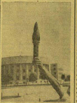
Штафетна палица града Баниа Луке