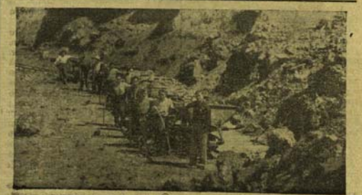
Изградњом широкогачице пруге Љубија — Брезичани омогућено се већи и бржи извоз жељезне руде на чијем ископавању ударили су радници рудари Љубије.

Такође учесници ове акције дали су обавезе да ће се у будуће одлазити у већем броју за изградњу овог пруге.