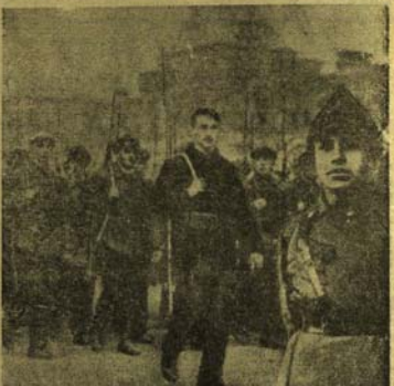
Црвена Армија, чедо Октобарске револуције на Црвеном тргу 1918 године ..

Ја сам наредно да се скину завртници, ручнице и преносни точкови. Све смо стопали у шак, који је одмах одијети комесару реона. Тако смо обезбједили везу са Выборгским рејоном.