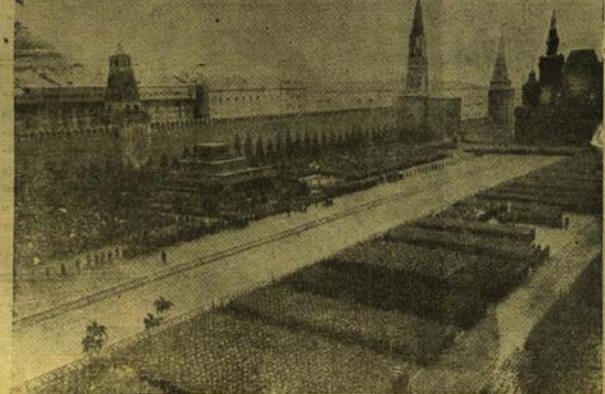
Црвена армија ослободила је човјечанство, којим је горви највећих тековина слободе и мира

Привремена влада престала је да постоји. Државна власт прешла је у руке Совјета. Д. Бистров