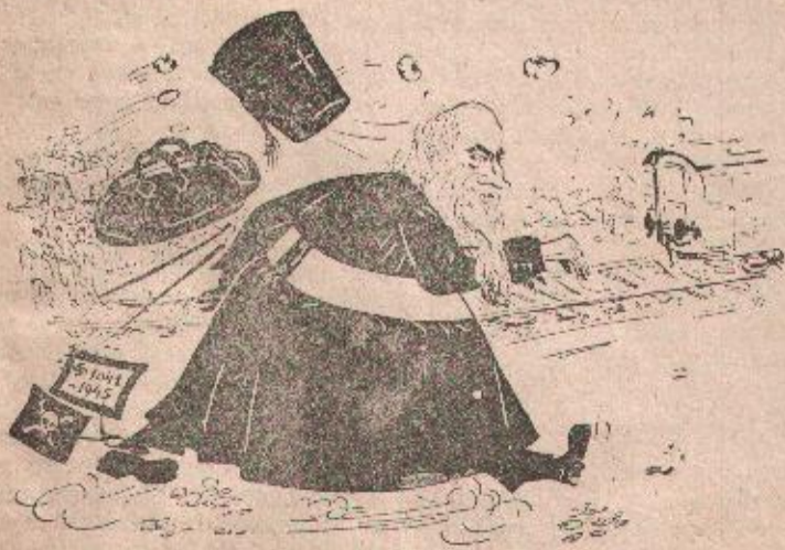
. . . „blagoslov“ naroda