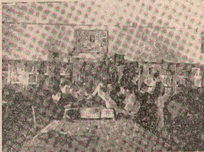
Iz čitaonice u Dubici