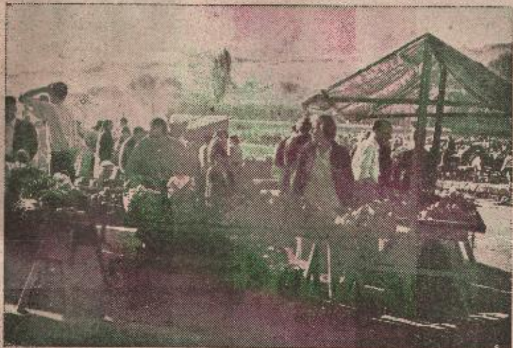
Jutro na banjalučkoj pijaci

nižom cijenom nema nekog ekonomskog opravdanja. Podaci koje iznosimo, daju potrošačima za pravo i tačno je da trgovinska mreža koji put pretjera u svojim cijenama. Pazarnog dana 29. septembra ponuda nekih vrsta voća i povrća bila je obilna, a kupovina od strane potrošača slaba zbog visokog