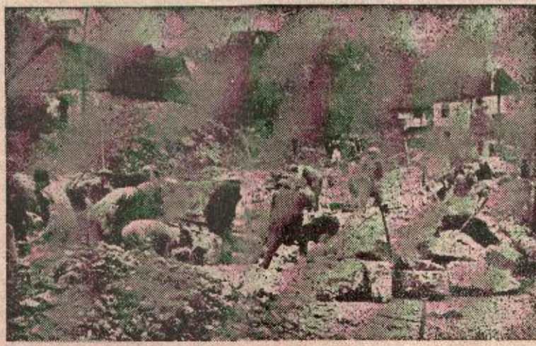
U Mrkonjiću se pred proslavu ZAVNOB-a i ulice opravljaju