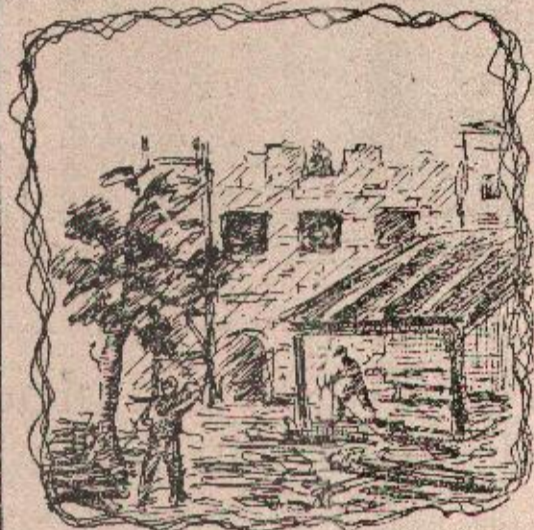
Crtež: H. Begović

i domaćice sa Paprikovca i Močila, koji su ranije išli nekoliko kilometara po vodu, a sada je imaju blizu da je i u kuće mogu uvesti. Za ove radove Narodni odbor