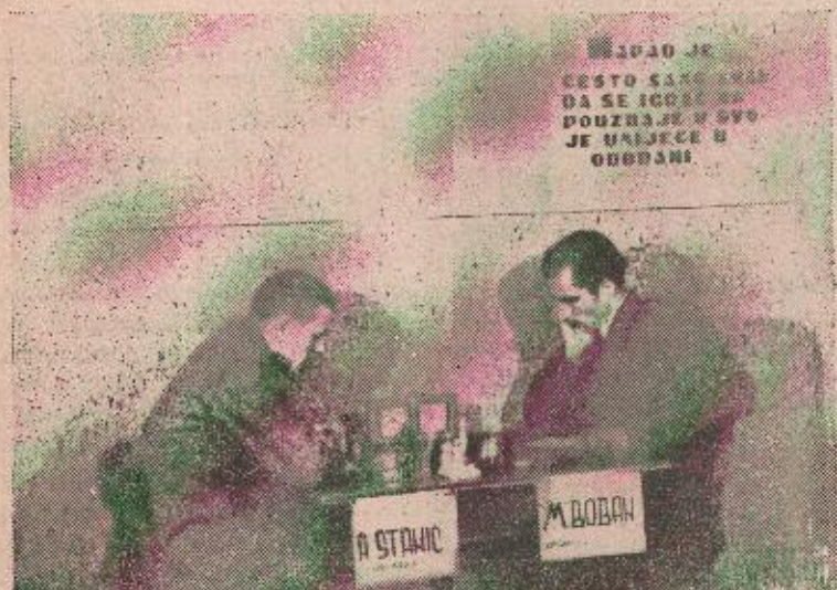
Sa ovogodišnjeg garnizonskog turnira