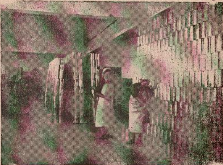
I banjalučka tvornica »Vitaminka« služi potrebama domaćinstva