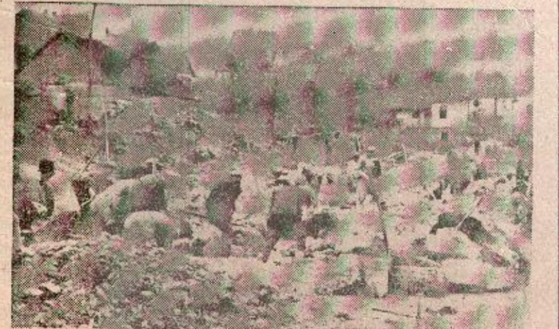
U posljednje vrijeme mnogo je učinjeno na opravi mrkonjićkih puteva