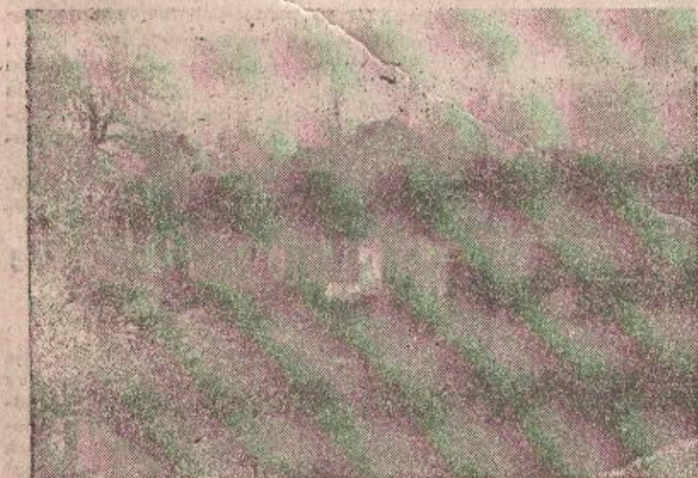
Ovakve kuće mjeravamo da isključimo iz stambenog fonda

KO JE KRIV ZA NESTAŠICU OGRJEVA U BANJOJ LUCI?