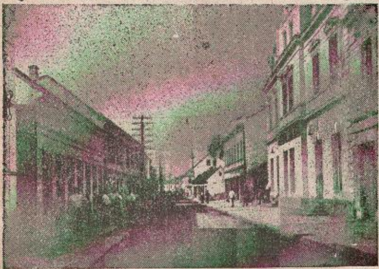
Iz centra Prijedora