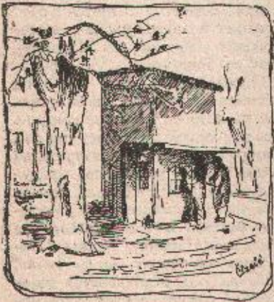
POVODOM ZABAVE FD »BORAC«

Nedjelja, 7 marta 1954. Gostovanje zagrebačke komedije i Borivoja Šembera. Šerber Hju »JEDNOM U 100 GODINA«, komedija u 3 čina (5 slika). Početak u 20 časova. Cijene ulaznica od 50—120 dinara.