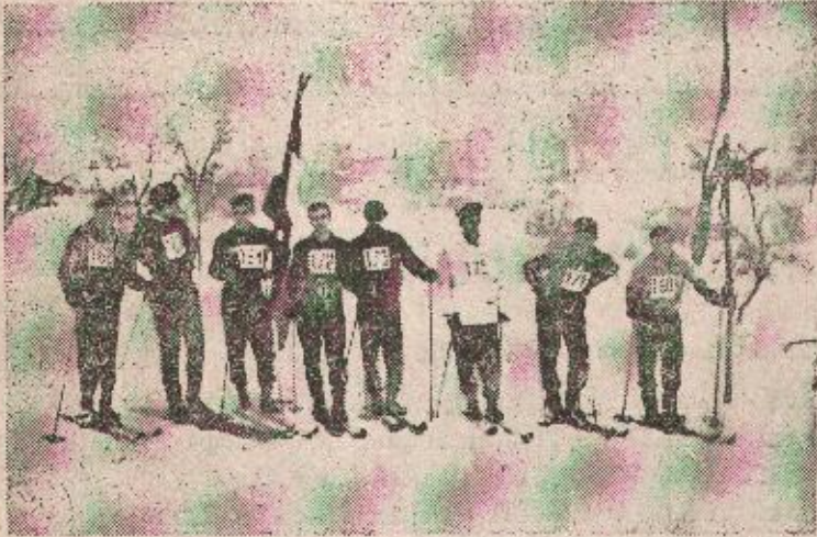
Sa prošlonedeljnog prvenstva u smučanju

Rezultati: Smuk — 9 takmičara — staza 800 m. — visinska razlika 65 m.