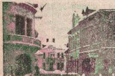
У центру града

школе и сада су услови за одвијање наставе много бољи него раније.