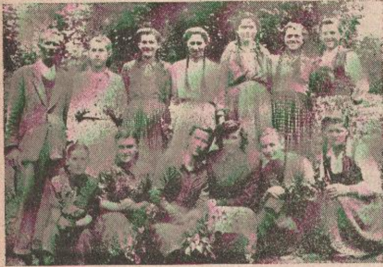
Na slici: polaznice jednog tečaja za zdravstveno prosvjeđivanje seoske omladine iz sela Zdena kod Sanskog Mosta