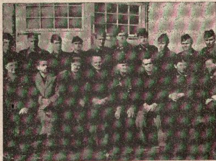
I Dobrovoljno vatrogasno društvo iz Prnjavora, održalo je ovih dana svoju godišnju skupštinu, na kojoj je bilo riječi o dosada postignutim uspjesima, i zadacima koji ih očekuju u ovoj godini.