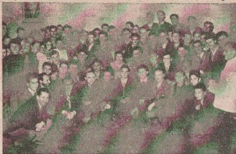
U vrijeme zimskog ferija grupa djece palih boraca iz bosanske Krajine posjetila je Beograd Na slici: gosti CDNJA