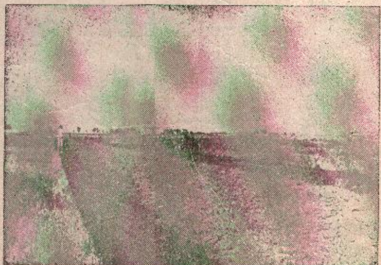
Rano proljeće izmamilo je prve orače. Ntve oživljavaju, prevrće se i puši masna zemlja

Na slici: za traktore u Lijevece putju ima puno posla.