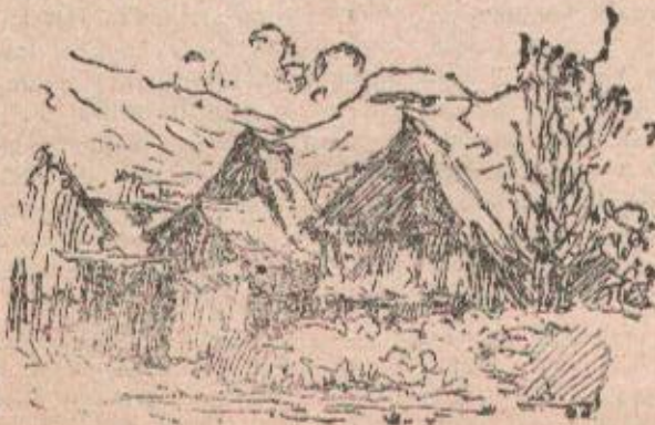
Motiv sa sela