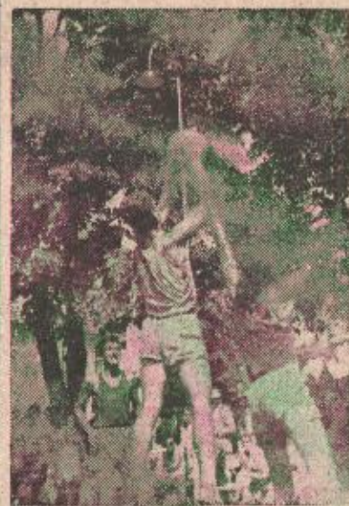
КОШАРКА ЈЕ ВЕОМА УЗБУДЉИВ СПОРТ