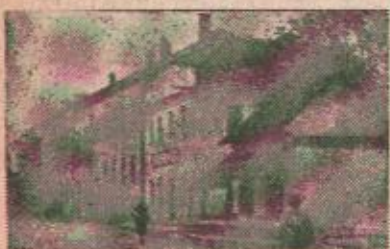
Nove zgrade u Sanskom Mostu

Iz analize o radu narodnih odbora opština, koju je podnio Dušan Vukić, član Sreskog komiteta i narodni poslanik i diskutuje po ovim problemima, moglo se konstatovati da je trenutno tu najvažnije pitanje: kako osposobiti današnje opštine da mogu prihvatiti i rješavati ona pitanja kojim se danas bavi narodni odbor sreza. Prenosjenje tih funkcija u