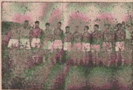
Слобода сигурно води на таблицаи Потсавезне лиге

Da budemo iskreni, očekivali smo da će Bratstvo ovoga puta prekinuti niz pobjeda Slobode, a to bi već bila »potsavezna» senza-