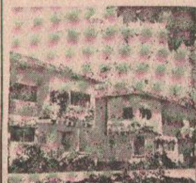
Новe зграде претстављање центра општине

— Ми ћемо, на примјер, — каже претседник — пред почетак нове године направити нови буџет и у њему морамо предвидјети и