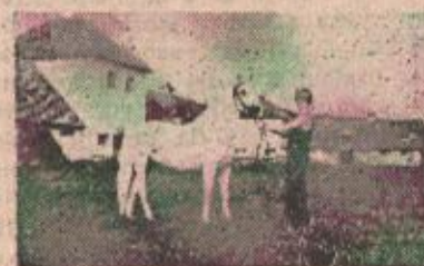
Iz pastuvske stanice