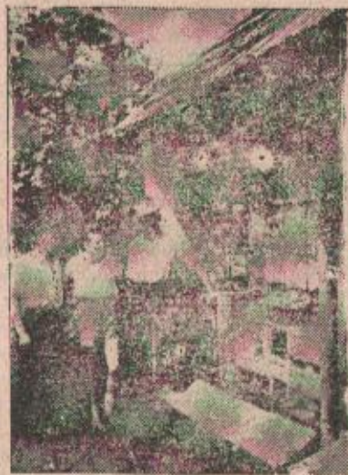
Zemljoradnička zadruga u Kobatovcima pored ostalih grana bavi se i pčelarstvom

ce. To pčele uznemiruje, uslijed čega će biti na proljeće mnogo ljuće, a mogu radi preobilnog trošenja hrane dobiti proliv, pa i uginuti. Zemljište pred pčelinjakom treba da je ravno, bez udubina, u kojima se stvaraju lokve i kaljuže, a nije loše da se ispred cijelog pčelinjaka naspe sitni pijesak, radi brzog i lakšeg sušenja u proljeće, a pripomoći će i pčelama pri njihovom proljetnom povraćaju sa pašne, ako padnu na zemlju, da se lakše ponovno uzdignu i domognu svoje košnice. Pri povoljnim danima u ovom mjesecu, ako bi pčele uzletale, biće i povoljan znak za njihovo zimovanje, pošto mlade pčele, koje su se izlegle u septembru imaju stvarnu potrebu za češćim izletanjem i pročišćavanjem. Takve izlete ne smije pčelar da ometa i da se boji, da sunčano svjetlo dopire do košnica, pošto im ono ne škodi, kao što je to slučaj sa proljetnim suncem, od kojega trebaju da su zaštićene.