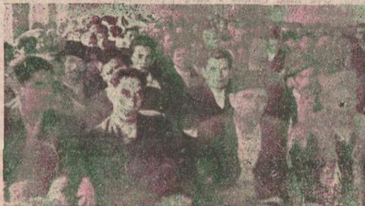
Sa izborne konferencije u Gornjem Šeheru