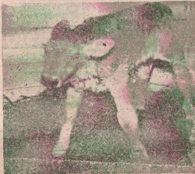
Prvo tele u Centru za osjemenjivanje

Centar djeluje već osam mjeseci i od njegovog prvog otvorenja u njemu je osjemenjeno preko pet stotina krava. U istom vremenu liječeno je 450 krava i junica, većim dijelom od privatnika, kod kojih je većim dijelom bilo u pitanju oboljevanje od zaraze i njenih posljedica. Centar je svoju djelatnost razvio naročito na državnim poljoprivrednim dobrima. Na pri-