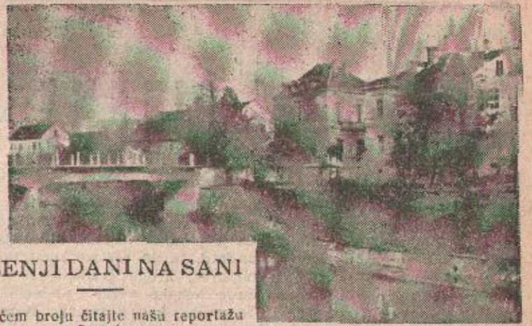
JESENJI DANINA SANI

U idućem broju čitajte našu reportažu iz Prijedora