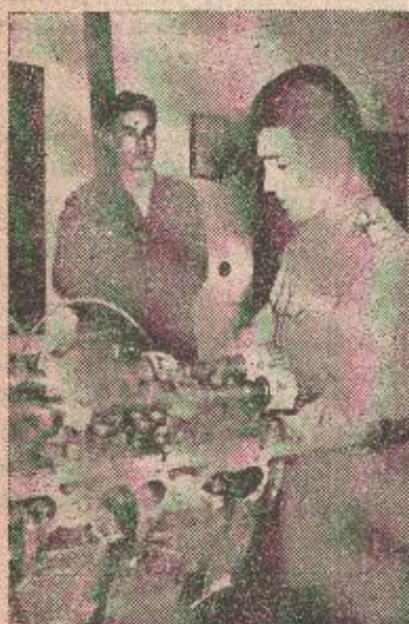
Na času tehnike

— Dakle, drugovi vojnici — otpočeo je mirnim i prijatnim glasom nastavnik kapetan — danas ćemo ukratko obnoviti najvažnije posljednje događaje na koje smo naišli, prateći našu dnevnu štampu. Evo, sada na primjer čitava naša zemlja sa velikom pažnjom i interesom