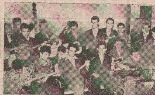
Na probi tamburaške sekcije