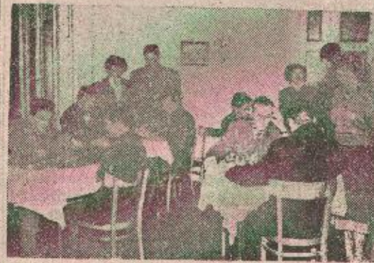
U društvenim prostorijama