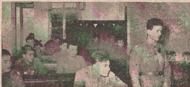
Čas političke nastave u Tenkovskoj školi

— Druže kapetane, na poziv indiske i burmanske vlade Pretsjednik Republike drug Tito otišao je u prijateljsku posjetu