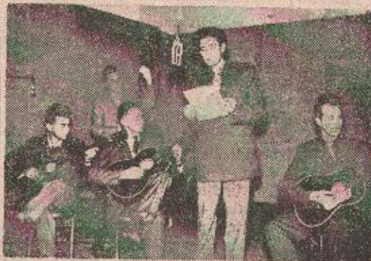
Ansambl gitara na Radio stanici