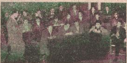
Esperantisti na času