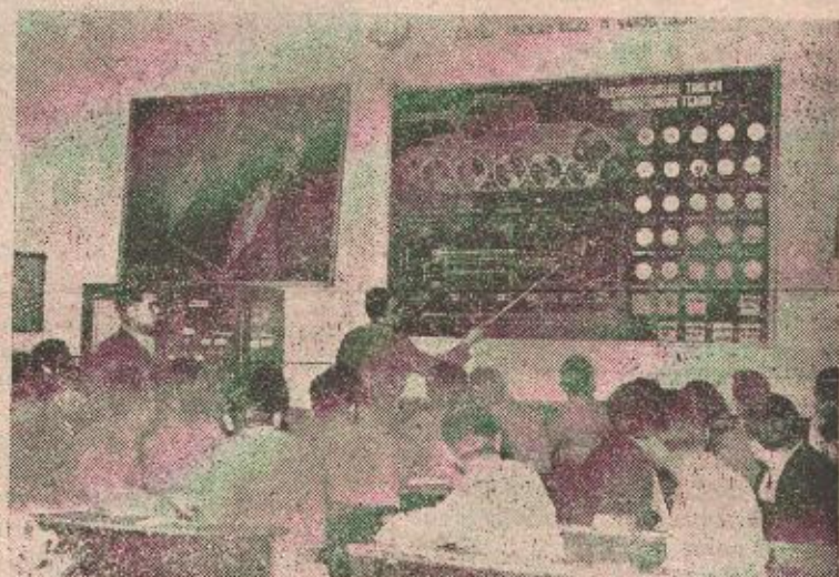
U kabinetu za održavanje vozila

Uporedo sa izučavanjem predmeta iz različitih oblasti vojne nauke i predmeta opšteg obrazovanja, u školi se odvija bogat i raznovrstan kulturni život. A za to pitomcima stoje na raspoloženju biblioteka, radio i gotovo sve novine i časopisi. Srijedom po podne oni posjećuju bioskop i o svakom filmu koji gledaju, kasnije se prođiskutuje. Kulturni život odvija se kroz rad nekoliko sekcija, šahovsku, diletantsku, fclklornu, likovnu i pjevačku i pitomci se prema ličnim sklonostima i interesovanju opredjeljuju za aktivno dječovanje u jednoj od njih. Oni, pak iz druge godine, pored ostalog uče i moderne igre za što ih prema poseban nastavnik, a u okviru nastavnog programa uče i predmet: vladanje i ponašanje. Ne nastoji se da pitomac bude samo dobar i spreman starješina, već i svestrano obrazovan pripadnik Armije koji će sutra bit vaspitač i drugih koji u nju dolaze. A sutra, kada po završenom školovanju budu raspoređeni u jedinice, na njihovom znanju i iskustvima počivaće ogroman dio odgovornosti koja se očekuje od njih kao budnih čuvara naše nezavisnosti i mirnog, stvaralačkog života. D. Č.