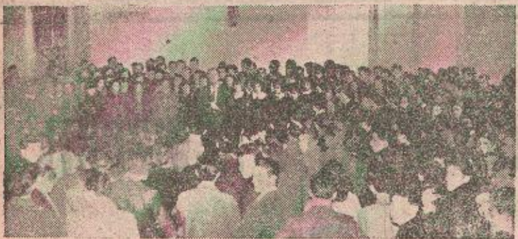
Sa proslave u Učiteljskoj školi

uglavnom tretirala rad Organizacije Ujedinjenih nacija i njenih specijalizovanih agencija. Umnoženi referati razaslati su skoro svim podružnicama sindikata koje su održale sastanke na kojima se govorilo o pravima čovjeka (D)