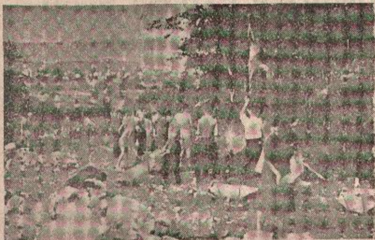
Sa prošlogodišnje radne akcije

Odbor za komunalna pitanja pri Gradskom odboru Socijalističkog saveza sistematski će proučavati ovu problematiku, koordinirati aktivnost osnovnih organizacija i na osnovu realnih mogućnosti predlagati rješenja. Evo nekih od zadataka koje će rješavati odbor: opravka i uređenje ulica, kupališta i izletišta, uređenje dječjih igrališta, vrtova i vanjskog izgleda zgrada, izgradnja novog sportskog stadiona itd. Ovakvo obimni zadaci rješavaće se stalnom saradnjom odbora za komunalna pitanja gradske organizacije Socijalističkog saveza i Savjeta za komunalne poslove Narodnog odbora grada, zajedničkim korištenjem snaga i sredstava. Ovih dana održaće se u tom cilju i šire savjetovanje sa predstavnicima osnovnih organizacija SSRN da bi se usmjerila aktivnost na rješavanje određenih komunalnih pitanja. Odbor će, kao jedan od svojih prvih zadataka, organizovati uređenje grada za proslavu desetogodi-