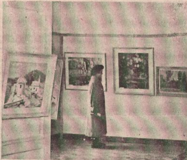
Jugoslaviji, već i u Evropi predstavljaju pojam u umjetničkom svijetu. Iako većina tih umjet-

riskom prošlosti — potvrđuje s pravom mišljenje da je Banjoj Luci neophodno potrebna umjet-