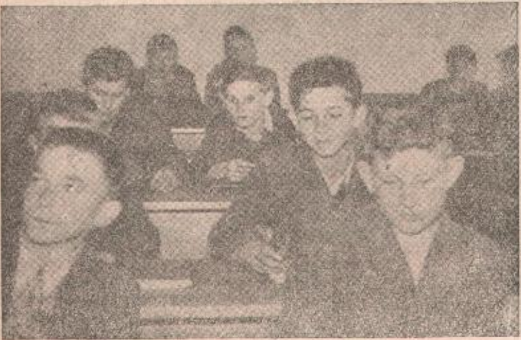
IZ OSMOGODISNJE ŠKOLE U ROSULJAMA

Do 1947 godine u Banjoj Luci nije postojala Srednja medicinska škola. Redovna nastava na ovoj školi počela je 1. oktobra iste godine. U prvo vrijeme na školi su radila samo dva odsjeka: odsjek sanitarnih tehničara i medicinskih sestara koje je pohađalo 70 učenika i učenica. Godine 1948 sagrađena je nova školska zgrada, u kojoj sa radom pored već pomenutih odsjeka, počinje da djeluje i odsjek viših sanitarnih laboranata. U to vrijeme u 5 odjeljenja bilo je upisano 173 učenika. Prvi maturanti, 26 sanitarnih tehničara i 42 medicinske sestre, napustili su školu u 1949/50 godini. Zaključno sa školskom 1953/54 godinom u Srednjoj medicinskoj školi diplomiralo je 1342 učenika - sani-