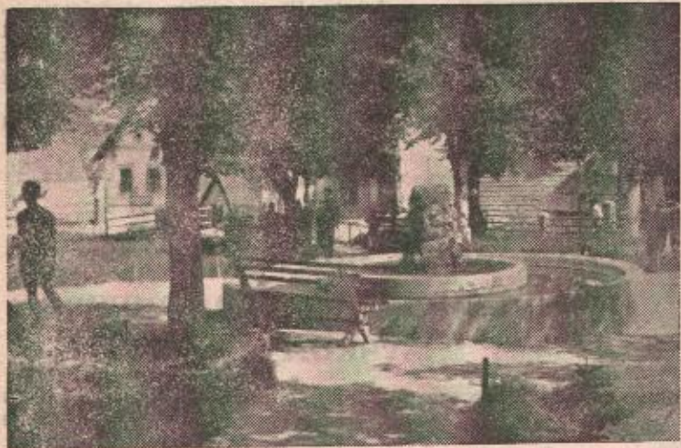
PARK U MRKONJIČU

Zahvaljujući sve većoj brizi i materijalnim sredstvima koja se ulažu djeci palih boraca i žrtava fašističkog terora u Mrkonjičkom srezu omogućen je svestran razvoj