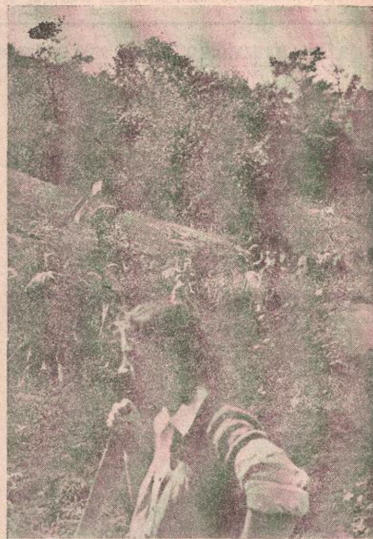
Na izgradnji pruge Brčko-Banovići učestvovalo je 8 banjalučkih brigada i 4 čete sa 3775 omladinaca i omladinki, a na pruzi Šamac-Sarajevo 19 brigada sa 4890 Na slici: Sa jedne omladinske radne akcije

Radi stabilizacije cijena sirovoj koži čiji stalni porast izaziva poremećaj na tržištu imaksimirane su cijene po kojim se koža prodaje industriji. Otkupna preduzeća »Kožar« i »Crevar« međusobno se utrkuju u nabičanju cijena pri otkupu, a onda se regresiraju prisiljavajući industriju da im plaća skuplje od utvrđenih cijena. Oni se pri tome služe i nedozvoljenim sredstvima, zaračunavajući visoke manipulativne troškove i unoseći u fakture veće količine kože nego što su stvarno isporučili. Tako je na 9 miliona dinara isporučene kože Tvornica obuća priznala »Kožar« (Nastavak na 2 strani)