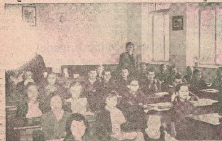
U III NIŽOJ GIMNAZIJI

Odmah poslije oslobođenja sa radom je počeo učiteljski tečaj sa 54 polaznika, a koncem maja počinje sa redovnom nastavom i Učiteljska škola. U to vrijeme, uslijed oskudice u učiteljskom kadru upisuje se veliki broj učenika u ovu školu, preko normalnog kapaciteta. Pored toga, pri školi je sve do prošle godine radio tečaj za upotpunjavanje školske spremne privremenih učitelja.