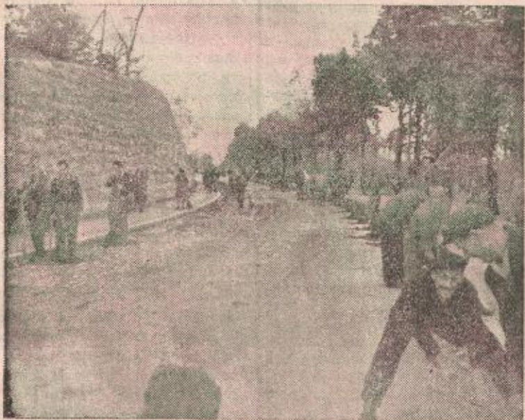
Sa jedne od radnih akcija u Kozarskoj ulici

Za 180 dana, a tri nedelje prije roka napravljeno je 80 km. pruge. Time je omladina pokazala da je ostvarljivo ono što su mnogi smatrali nemogućim, pobijedila je stare predrasude, srušila stare norme i pokazala narodu da je ona garancija njegove sreće.