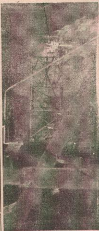
ZICARA U LJUBIJI

Tekom prošlih godina, a naročito prošle, na području Prijedorskog sreza zabilježen je osjetan porast svih grana proizvodnje, a naročito industrijske. Proširenjem i boljim korištenjem postojećih kapaciteta, kao i puštanjem u pogon novih, planirani obim proizvodnje u većem broju njih ne samo da je izvršen, već i u znatnoj mjeri i premašen. To je naročito karakteristično za Tvornicu celuloze, rudnik Ljubiju, zatim ciglanu »Krajina«, kao i za nova industrijska predu-