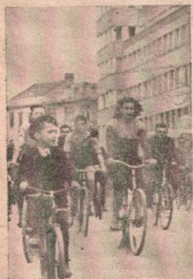
На слици: Бикцидисти BSK-а на пробној возњи кроз град