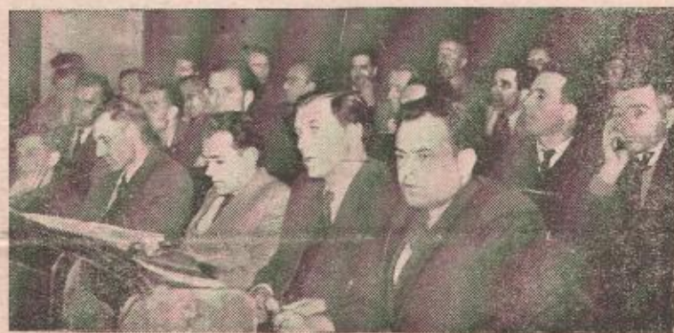
Predstavnici srezova na savjetovanju u Banjoj Luci

bi to uslovalo znatno povećanje teritorije ostalih opština što bi opet, s obzirom na rasutost sela, nepostojanje dobrih komunikacija i njihovu slabu međusobnu povezanost, u znatnoj mjeri otežalo rukovođenje budućim opštinama-komunama.