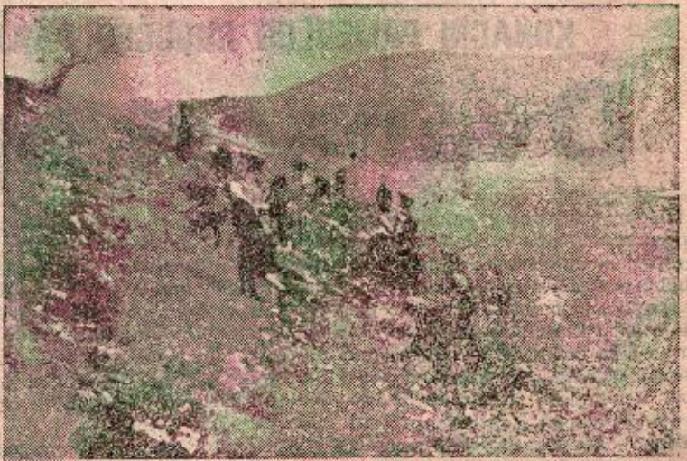
RAD NA POŠUMLJAVANJU