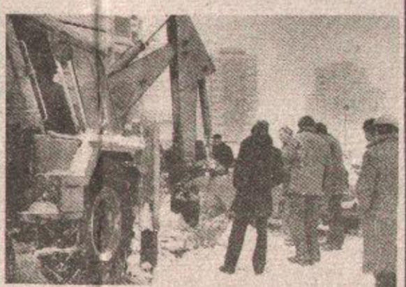
Bager „Vodovoda i kanalizacije“ sklanja led sa šahta

Najprije je trebalo pronaći mjesto gdje je pukla cijev i zatvoriti ventil, jer kako bi se mogla ispustiti voda, koja je u trafostanici bila duboka 82 centimetra, a potom provjeriti ispravnost uređaja prije puštanja trafo-stanice u rad.