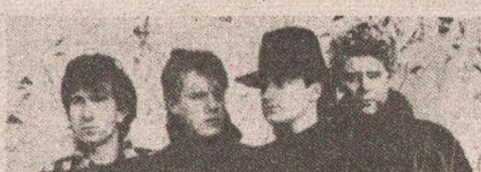
Irski grupa „U 2“; Moglo se desiti i da prekinu koncert, da na vrijeme nisu shvatili o čemu se radi

„U prvi mah pomislio sam da su počele neke demonstracije ili pobuna - kaže gitarista grupe Dejv Evans. - Pogledao sam ostale u grupi i upitao da li da prekinemo