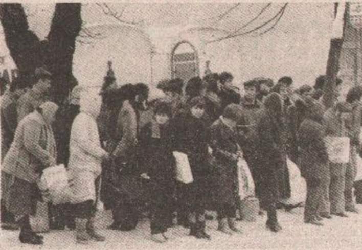
Na niskoj temperaturi i do minus 18 — autobusi se dugo čekaju — nekad i uzalud

Vozачи i svi oni koji brinu o vozilima i pripremaju ih na linije u radionicama „Autoprevoza“ žale se i na loše gorivo. Zaleđu se dovodi goriva, kako oni kažu, i to je sada najveći problem. U takvoj situaciji i liju-