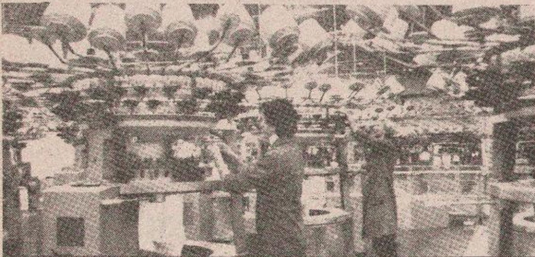
Nedostaje 250 tona visokokvalitetnog prediva iz Tvornice pamučnog pletiva

dine zbog nedostatka pilica za klanje i doradu morala obustaviti proizvodnju više od dva mjeseca. Cjelokupna brojlarska proizvodnja