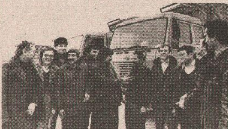
У веома тешким условима „Ротасови“ возачи довозили су мазут, угљ и сировине за индустрију

Сусрет представника бањалучке друштвено-политичке заједнице са представницима колектива „Ротас“ био је прилика да се размијене мишљења о положају ове транспортне организације која у врло тешким условима извршава своју функцију остварујући позитивне резултате. Ипак, још има доста празних ходова, конкуренција других превозника, посебно приватника које истичу запослени у „Ротасу“, морају рјешавати, али им је потребна и помоћ друштвено-политичке заједнице.