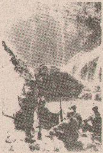
Drugovi Bakarić i Popović, sjeća se Skrigin, dali su mu zadatak: snimiti slobodna Plitvička jezera (ovu fotografiju AGITPROP je poslao u Zagreb za širenje propagande NOB-a)