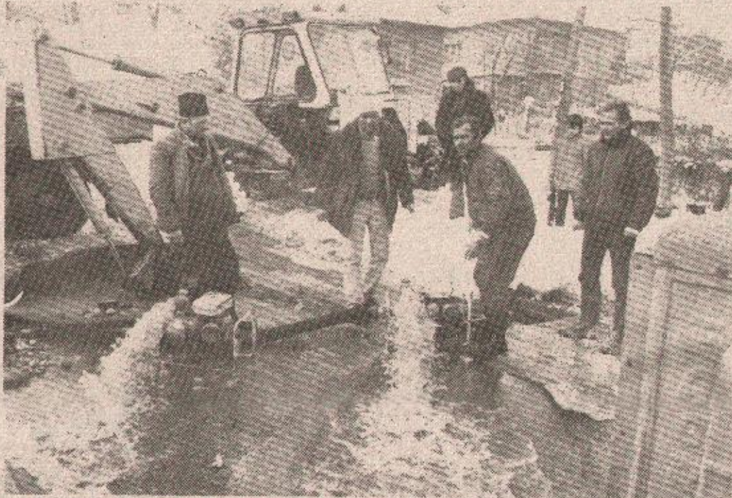
Радници „Водовода и канализације“ настоје што прије отклонити квар