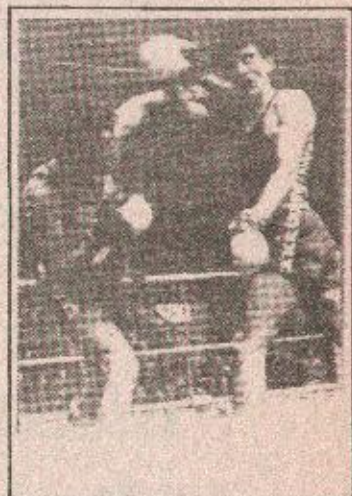
Pa se u čudu pitaju: Nije, valjda, da se jugoslovenski bokseri odustali od sjajne prilike: bar je Budimpešta blizu, ako je u pitanju štednja.

Ali, vrlo su iznenađeni organizatori iz Budimpešte. Nikako ne mogu da vjeruju da se niko iz našeg saveza još nije sjetio da pošalje pismenu prijavu, kao i svi ostali. Rok je odavno prošao.