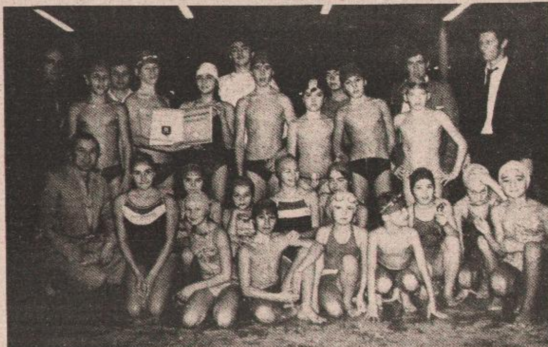
BEZ PREMCA: Članovi Plivačkog kluba Termal

KRANJSKA GORA - (Tanjug) - U Kranjskoj Gori će se 15. i 16. februara ove godine održati velesalom i slalom za svjetski kup za muškarce. To je poslije završetka takmičenja u slalomu za Balkanski kup. Organizacionom komitetu „Kup Vitarca“ u Kranjskoj Gori i telefonskom razgovoru potvrdio predsjednik Komiteta za svjetski kup Serž Lang.