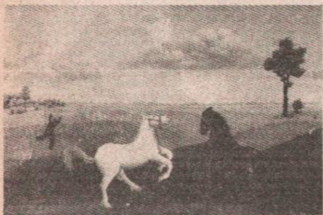
Ivan Generalić: Konji, 1956. godina