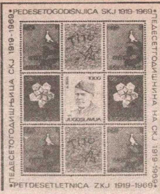
PEDESETOGODIŠNICA SKJ 1919-1969 PEDESETOGODIŠNICA SKJ 1919-1969 PEDESETOGODIŠNICA SKJ 1919-1969 PEDESETOGODIŠNICA SKJ 1919-1969