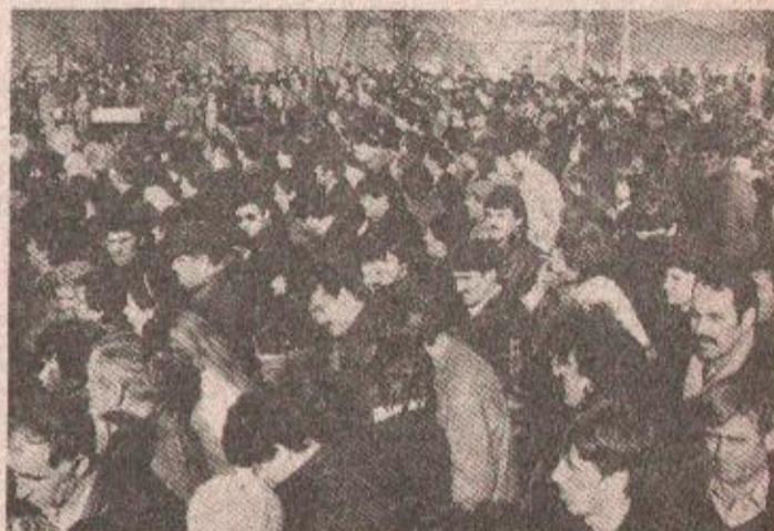
Davanju svečane obaveze prisustvovali su brojni roditelji, prijatelji, rođaci... pristigli iz cijele zemlje