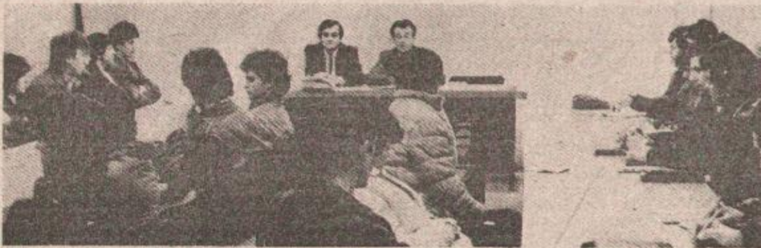
Polaznici škole Socijalističkog saveza