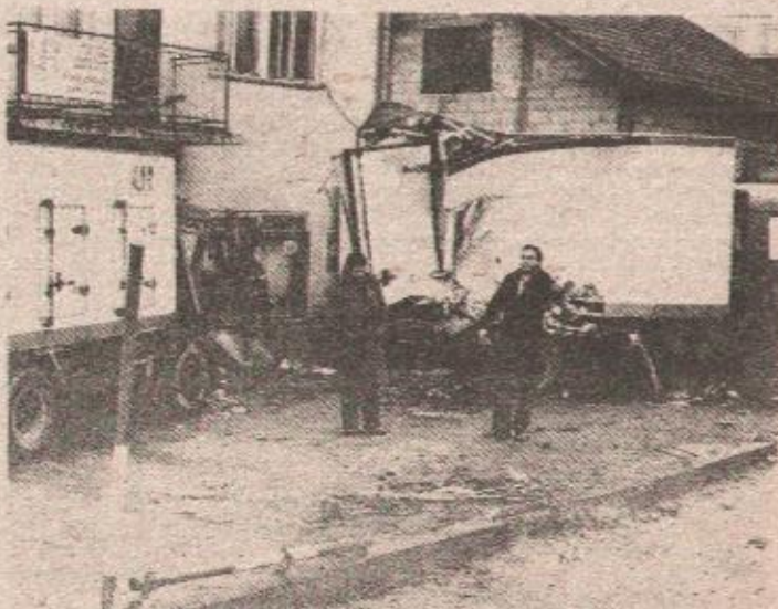
Prizori poslije teškog sudara u Zalužanima