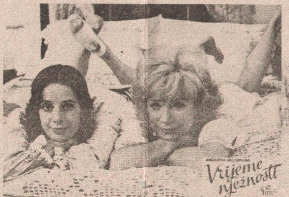
Kadar iz americkog filma „Vrijeme nježnosti“