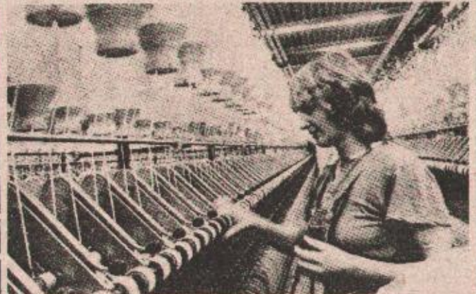
Iz pogona „Predionice“: neradnicima zatvorena vrata

— Naši radnici su 13 dana prije isteka lanske godine ispunili plan od 2.100 tona visokokvalitetne pređe i prebacili za 5 odsto. Svi radnici su svakodnevno informisani o realizaciji i postignutim rezultatima procesa proizvodnje. Na oglasnim pločama se obavještavaju o postignutim rezultatima u toku 24 sata. Komunisti moraju prednjačiti, ličnim primjerom služiti ostalim radnicima naročito u radnoj i tehnološkoj disciplini. Na to nas navode i zaključci 13. sjednice CK SKJ, programski dokumenti.