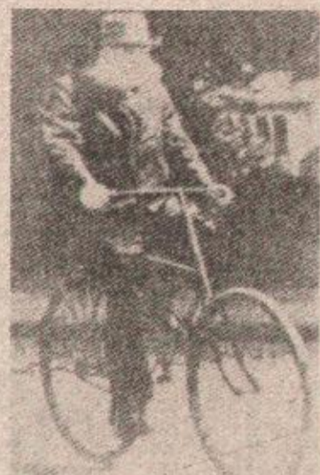
Dr Džon Denlop 1887. na biciklu „seffeti“

Sve do trenutka dok poznati irski veterinar iz Belfasta nije „obuo“ bicikl u gumu i vazduh, točkovi bicikla su tankrali drumovima širom svijeta.