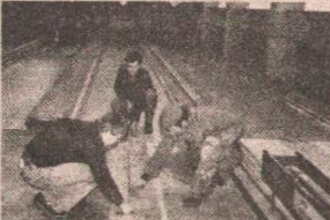
Završni radovi na kuglani

●Zahvaljujući izuzetnom entuzijazmu kuglaša i kuglaških radnika Banjaluke za samo dva mjeseca potpuno renovirana i plastificirana kuglana u Sportskoj dvorani „Borik“