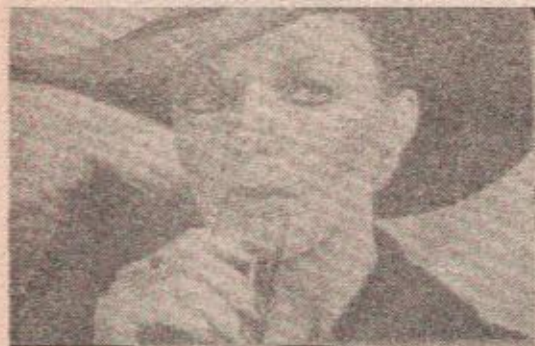
Džozo Kolins Bez nje - nema provoda...

Malo selo Gštat u švajcarskim Alpima gotovo cijele godine ni po čemu ne privlači pažnju, ali šest nedjelja svake zime postaje "Holivud na snijegu".