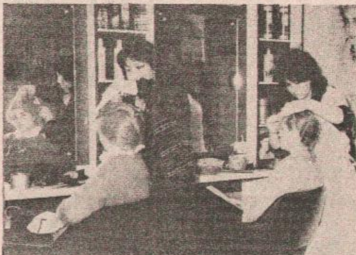
iz jednog frizerskog salona u Banjaluci

Kako objekt nije završen u 1984. godini, to se investitor morao obratiti za dodatna sredstva, pa je tako od Fonda za obnovu grada dobio 8,6 miliona dinara i sredstva solidarnosti još 685.000 dinara. Ovo prekoračenje Banka je odobrila i tako se vrijednost ulaganja u Kuću ljepote povećala na 28 miliona dinara.