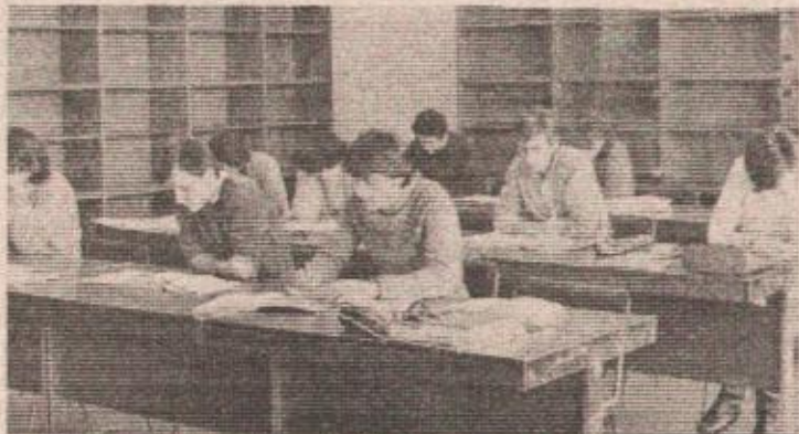
Iz čitaonice Univerzitetske biblioteke „Petar Kočić“

— Prema najnovijim podacima u svijetu se godišnje objavi oko 100 miliona naučnih radova, a publikuje se oko 30 miliona knjiga sa naučnim sadržajem. Isto tako se godišnje objavi oko 110.000 časopisa iz naučno-tehnološke i humanističke oblasti. Biblioteka nastoji da naučnom radniku olakša put do ovih informacija, tako da u planu imaju tehničko opremanje biblioteke (kompjutori,