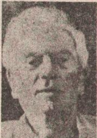
Ratni zločinac Andrija Artuković danas

Prije tog „obrt“ sudije Brauna niko od učesnika i posmatrača u ovom procesu nije ni slutio da bi odluka mogla biti neka druga, sem one koja nalaze izručenje. „Jedini koji se još nadao da bi izručenje moglo biti sprječeno bio je moj branjenik Artuković“ - rekao je u pauzi poslije tog „šoka“ advokat Geri Flajšman, ostavljajući u dilemi one koji su ga čuli i koji nisu znali, dali se on tošegajući na račun Artukovićeve izlapanosti, na čemu odbrana i dalje insistira, ili je zaista tako bilo.