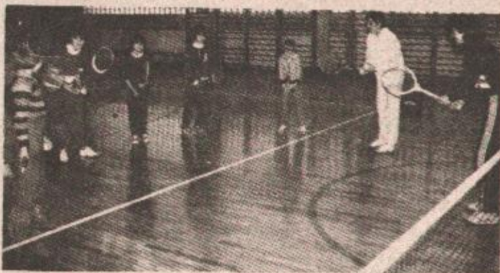
Sa jednog od treninga najmlađih

● U očekivanju formiranja Društva za sportsku rekreaciju „Partizan“, pri Mjesnoj zajednici Rosulje, teniska sekcija svakodnevnim treninzima okuplja oko 300 članova