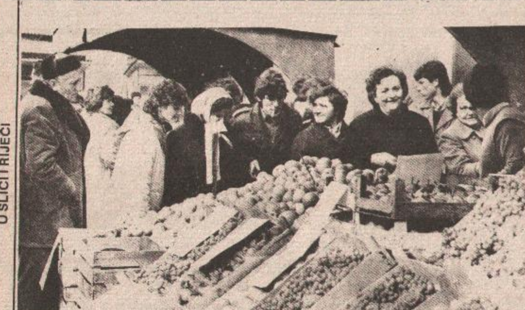
U SLICI I RIJEČI