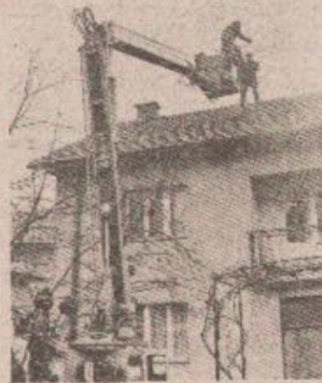
Ekipa „Elektrobanjaluka“ prilikom otklanjanja kvara

Na lice mjesta odmah je izašla dežurna ekipa OOUR-a „Elektrobanjaluka“ i kvar je nakon dva sata otklonjen. Varničenje i plamen, koji su nastali prilikom kratkog spoja, izazvali su paniku u nekoliko kuća, a