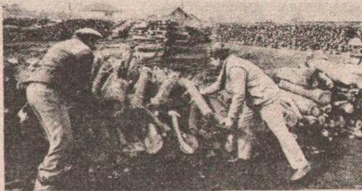
Na skladište „Grada“ drvo stiže redovno, ali ga niko ne kupuje

To je znatno ispod potreba, koje se procjenjuju na 42000 tona, a manje je i od količina ugovorenih prošle godine (35070 tona). Za ovu godinu je ugovoreno 18000 kubnih metara drveta, od čega za januar i