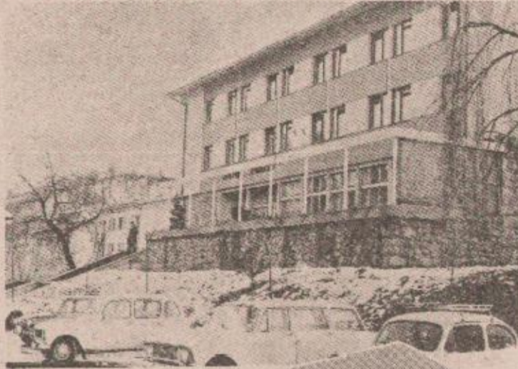
Do kraja godine proširenje hotel „Turlat“