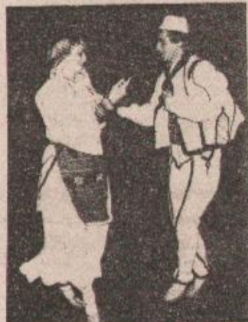
Sa jednog od nastupa RKUD-a „Jelšingrad“