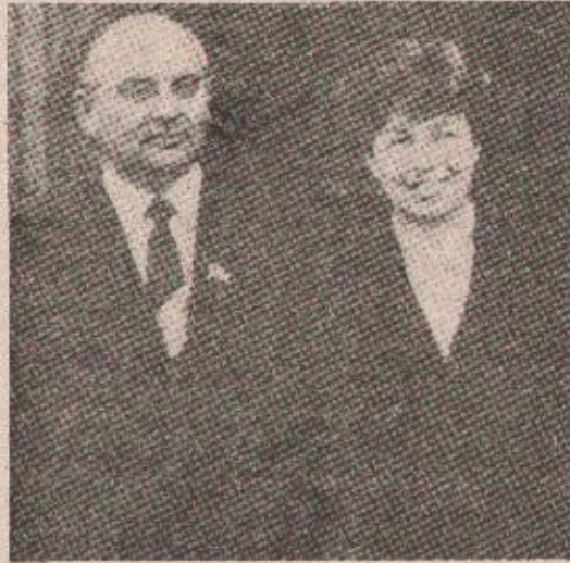
Mihail Sergejevič Gorbačov sa suprugom Ralsom, snimljen prilikom nedavne posjete Londonu

I zato Gorbačov insistira na intenzifikaciji privredjanja u SSSR na osnovama nauke i nove tehnologije jer po njegovoj ocjeni „treba da dati opštenarodni karakter i takav politički značaj kakav je imala svojevjremeno industrijalizacija zemlje“. Kao i njegovi prethodnici, Gorbačov dobija ulogu lidera kontinuiteta