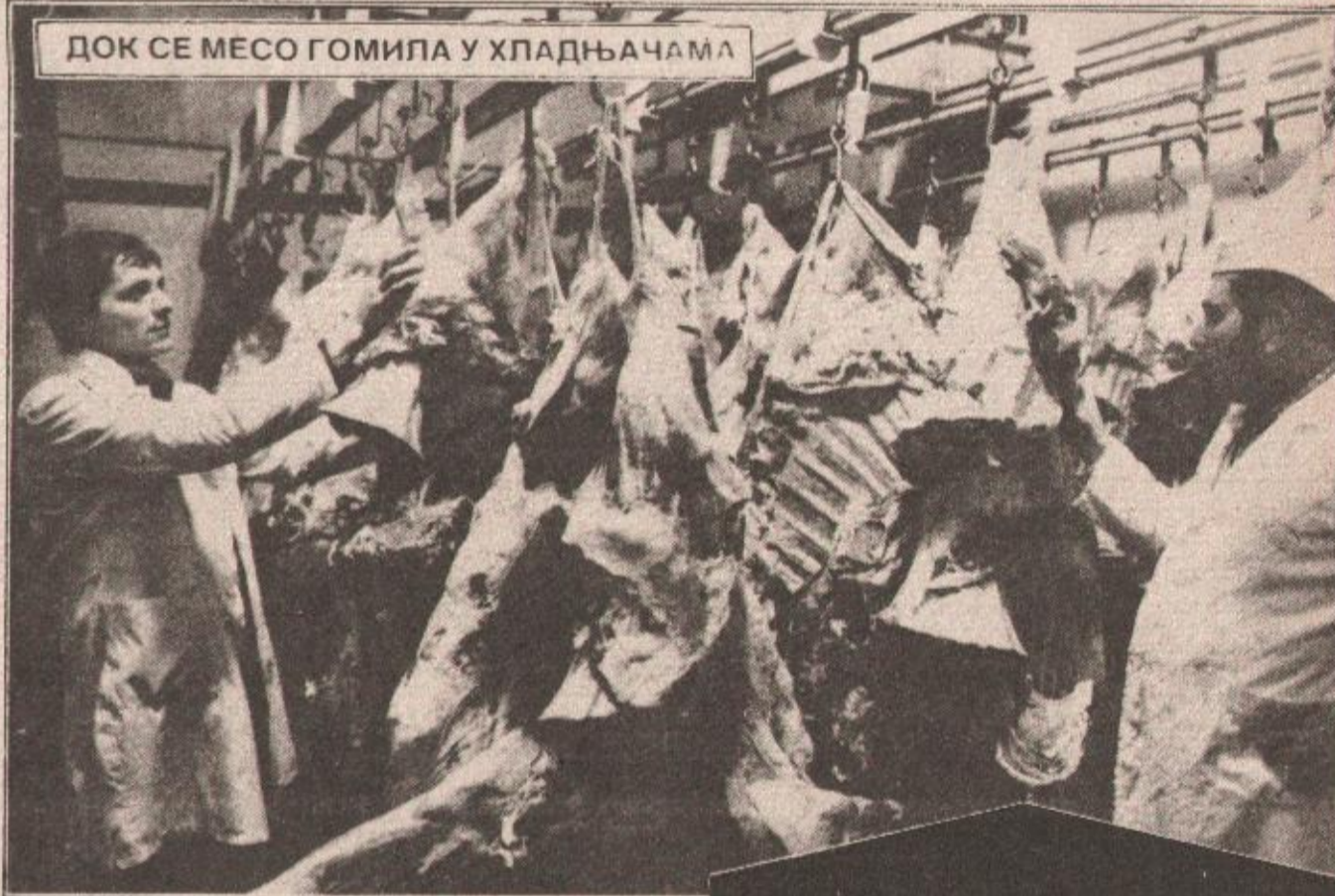
Детаљ из клаонице у Бањалуци: хладњаче су пуне

НА ИНФЕКТОЛОШКОЈ КЛИНИЦИ У БЕОГРАДУ ПРИМЉЕН ЛЕПРОЗНИ БОЛЕСНИК