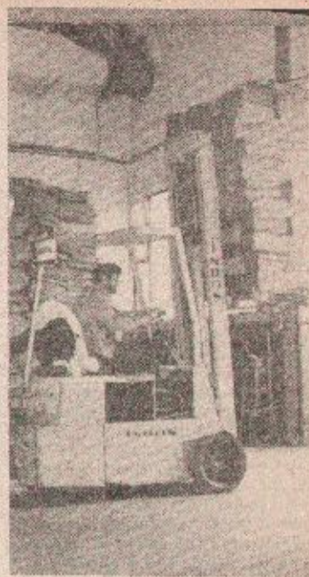
Detalj iz „Prerade papira“