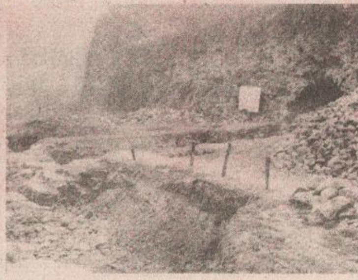
Vrijedne iskopine: detalj otkrivenih zidova uz Vrbas