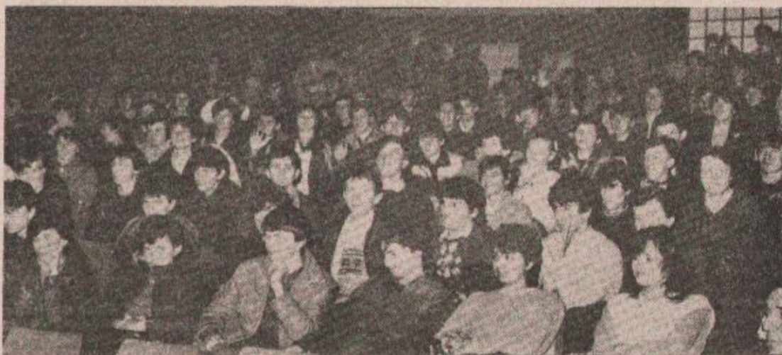
U Metalnoj školi...