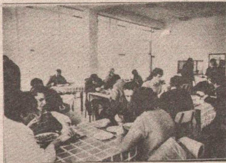
Iz restorana: ishrana bi mogla biti kvalitetnija

● Smještaj i ishrana u studentskom centru „Veljko Vlahović“ poskupjeli su prosječno za 29 odsto, tako da studenti sada plaćaju 5.514 dinara