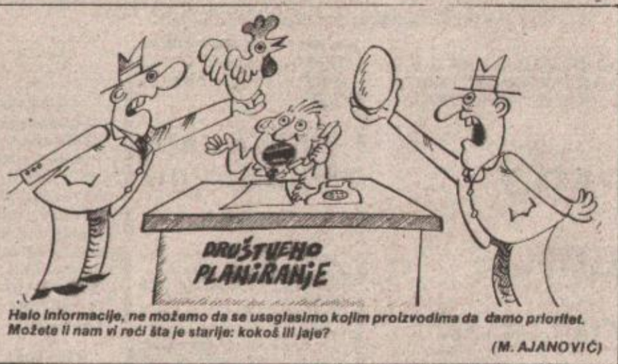
Halo informacije, ne možemo da se usaglasimo kojim proizvodima da damo prioritet. Možeta li nam vi reći šta je starije: kokoš ili jaje?