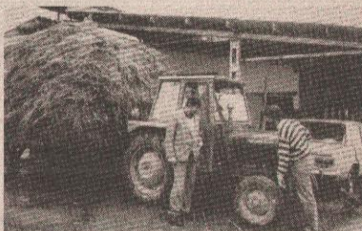
„Корист је очигледна од овог преусмјеравања општинског пореза“ - кажу земљорадници