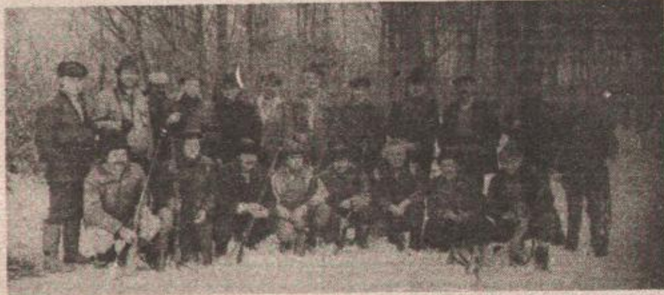
IZ LOVAČKOG DRUŠTVA „KOZARA“