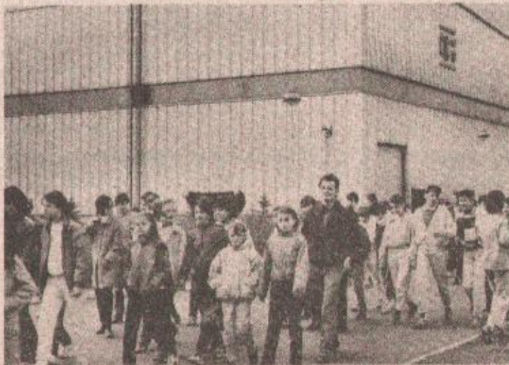
Ученици из Западног Берлина, са својим вршњацима из Бањалуке - у посјети Ваљаоници хладно-ваљане траке у Рамићима

СКУПШТИНА ОПК БАЊАЛУКА О ПРИВРЕДНИМ КРЕТАЊИМА У ПРОШЛОЈ И ПРВИМ МЈЕСЕЦИМА ОВЕ ГОДИНЕ