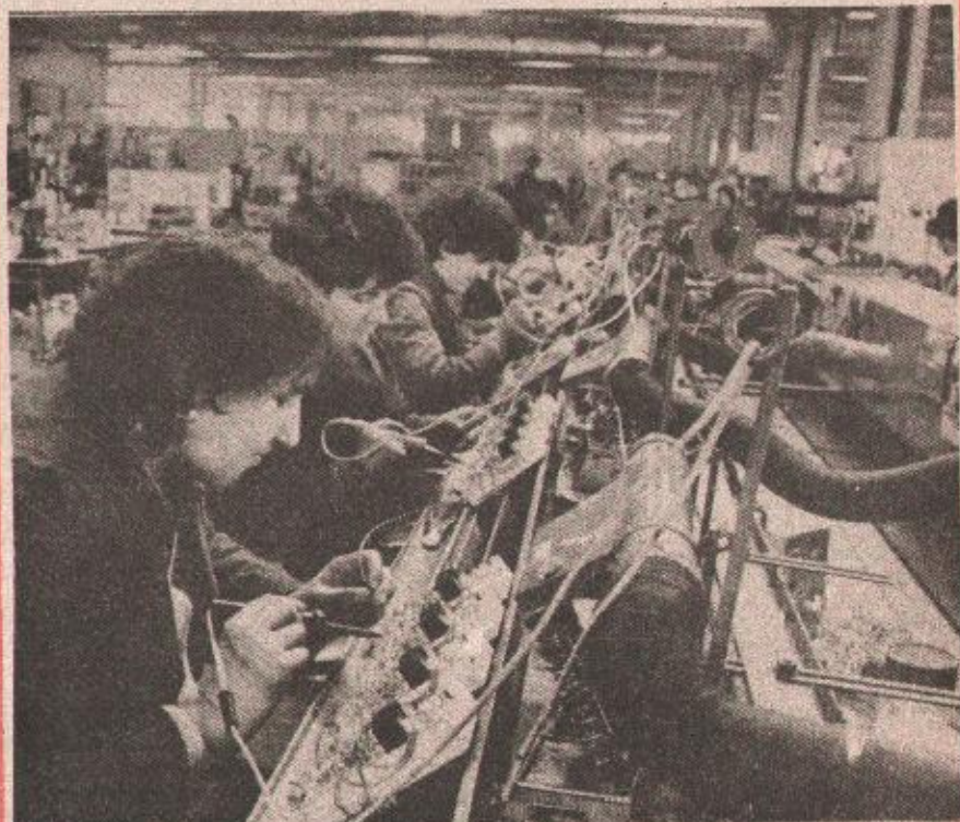
У више индустријских грана знатно расла производња: деталј из чеминачке фабрике „Руди Чајавец“

БАЊАЛУКА, 28. марта - За кретање индустријске производње у регији првих мјесеци ове године карактеристичан је раст од 5,7 посто у односу на исти период прошле године. Међутим, и поред позитивних општих показатеља, треба имати у виду да је овакав резултат остварен захваљујући изразито високом расту у шест индустријских грана: - базној хемијској индустрији, производњи електричних машина и