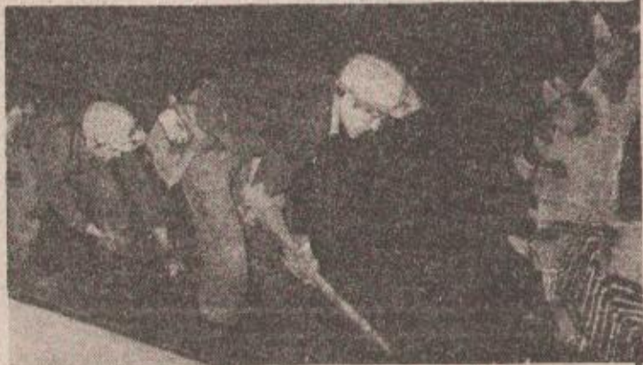
Lani proizvedeno dva miliona i 300 hiljada tona rude: sa kopovna Rudnika Ljubija

stambenu izgradnju ● Dobro ukupno poslovanje znači da ni jedan OOUR, kao ni radna zajednica nisu bili opterećeni gubicima