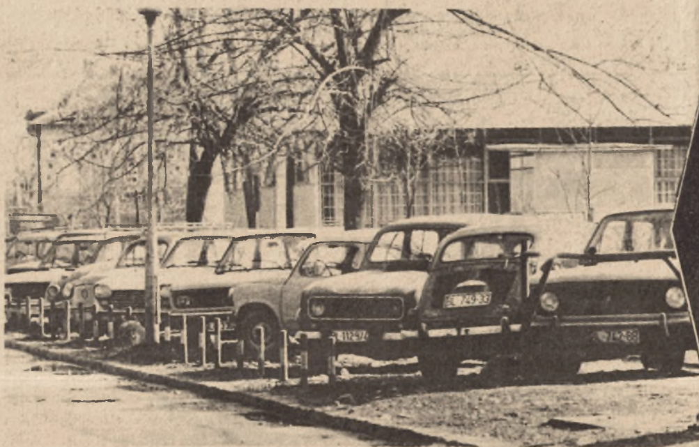
GLAS, petak, 5. april 1985.