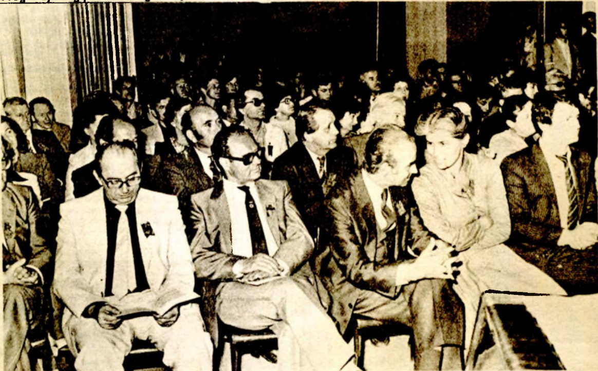
Sa jedne svečane akademije na Kikićevim susretima u Gradačcu

Kikić je poginuo 6. maja 1942. godine kao komesar Prvog krajiškog proleterskog bataljona