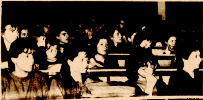
Studenti prate predavanje

OMLADINSKA TRIBINA NA PRAVNOM FAKULTETU U BANJALUCI