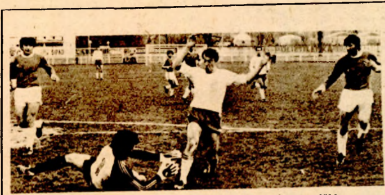
Napadač Jedinstva Samardžić pred golmanom Handžićem na utakmici protiv Radnika

će se vjerovatno vratiti i rekonvalescent Kovačević. Najvjerovatniji sastav Borca: Smajić, Gajić, Raičević, Mrkić, Đurđević, Bešlić, Topić, Omerhodžić, Džafić, Lupić, Kovačević. U konkurenciji su još Kuruzović, Špica, Popović, Pićan i Rama. U. P.