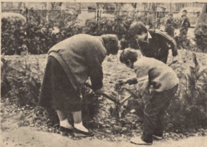
Gorani u akciji: u ovoj godini biće pošumljeno više goleti nego lani