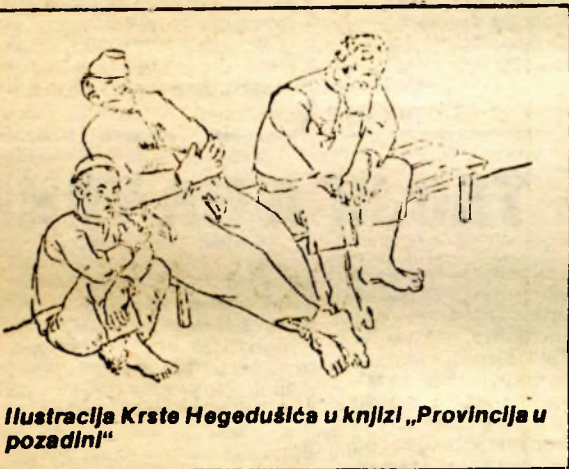
Ilustracija Krste Hegedušića u knjizi „Provincija u pozadini“

Propustili su ih da prođu nekih pedeset metara, a onda su pucali. Hasan je pao smrtno pogođen, a Nijemac je uspio da pobjegne i probije se do Skender-Vakufa. On je prvi i javio o Hasanovoj smrti“.