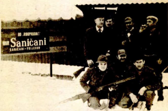
Krajem februara - pred lov na patke (arhivski snimak)

Već nekoliko godina divlje patke love najvećim dijelom lovci iz Italije. Upravo to želimo istaći jer cijene koje plaćaju strani lovci omogućuju OOUR-u Saničani sigurno sutra pogotovo što su svake godine sačinjavani definisani ugovori prema kojima se vrši plaćanje unaprijed - u punom