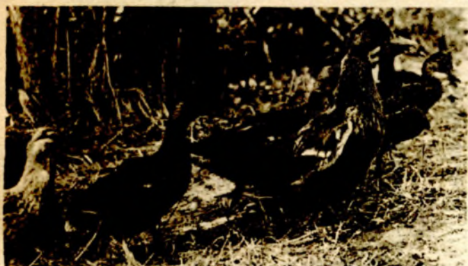
Motiv iz lovišta