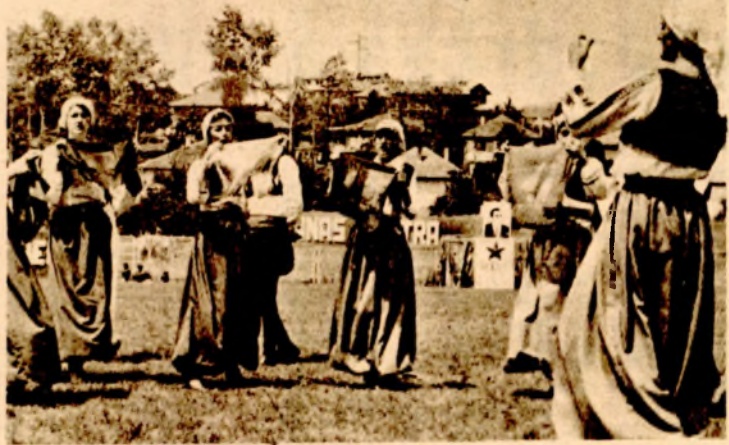
Svečanost u Cazinu se teško mogu zamisliti bez RKUD-a „Metalac“

CAZIN, 4. aprila — Za osam godina postojanja Radničko kulturno-umjetničko društvo „Metalac“ iz Tvornice žičanih proizvoda u Cazinu ima čime da se pohvali. Mnogobrojni nastupi u Krajini, u klubovima naših radnika u inostranstvu, na amaterskim smotrama i to da je kroz sekcije prošlo više od stotinu mladih radnika i učenika, svjedoči da cazinski „metalci“ vole i žele da rade.