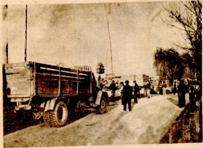
Odiuka INCEL-a da se zabrani rad privatnih prevoznika — blokira proizvodnju u Gas-betonu: učestala slika ispred Fabrike