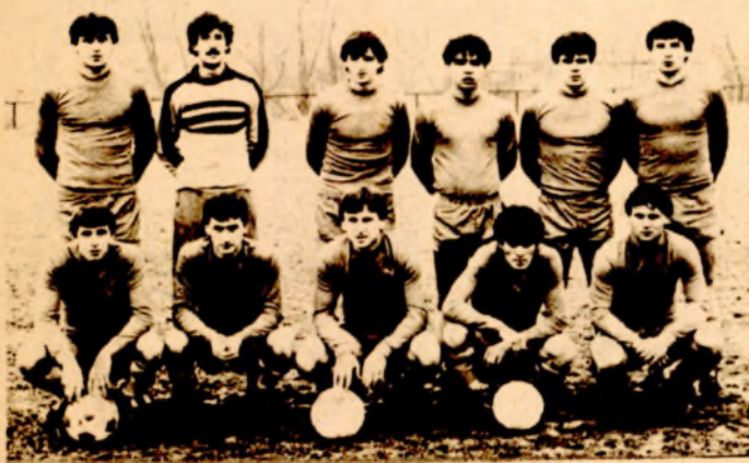
Fudbaleri Berek iz Prijedora