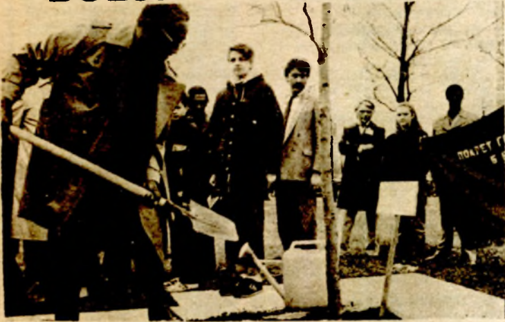
U Parku prijateljstva Barnem zasadio drvo mira

BEOGRAD, 15. aprila (TANJUG) — Predsjednik Predsedništva SFRJ Veselin Đuranović razgovarao je danas u Beogradu sa predsednikom Kooperativne Republike Gvajane Forbesom Barnemom, koji je na poziv Predsjedništva SFRJ juče doputovao u višednevnu posjetu našoj zemlji. Posebna pažnja posvećena je daljem razvoju i unapređenju bilateralne saradnje, naročito ekonomskih odnosa. Razgovori dvojice predsjednika i njihovih saradnika obuhvatili su i aktualna međunarodna pitanja i aktivnosti pokreta nesvrstanih zemalja.