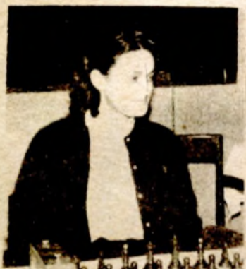
SJAJNA IGRA: Maja ČIBURDONOZE