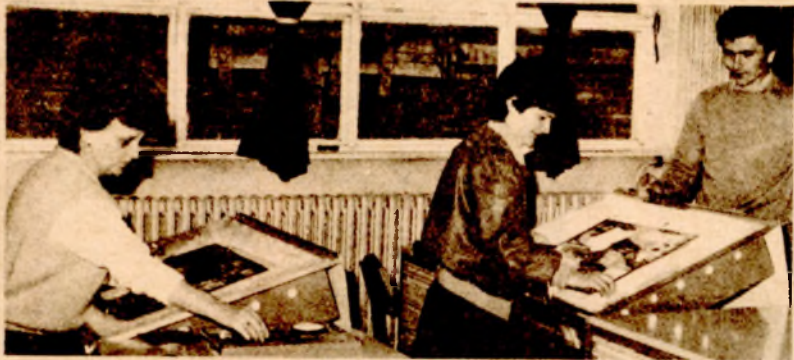
У савременој штампарији „Гласа“:

скупи папир и репроматеријал све већи проблем за издавача