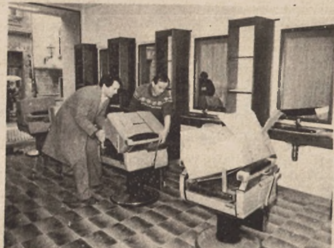
Radnici Zanatsko-frizerske zadruge postavljaju odgovarajuću opremu

Na 600 kvadratnih metara korisnog prostora, na četiri etaže radiće po deset muških i ženskih frizera, tri kozmetičara, dva pedikera... Kuća ljepote radiće u dvije smjene, a zaposlijaće 50 radnika