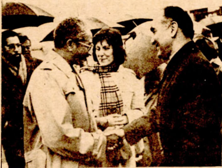
S beogradskog aerodroma F. Barnema ispratio V. Duranović

Tokom trodnevnog boravka u Beogradu predsjednik Barnem razgovarao je dva puta sa predsjed-