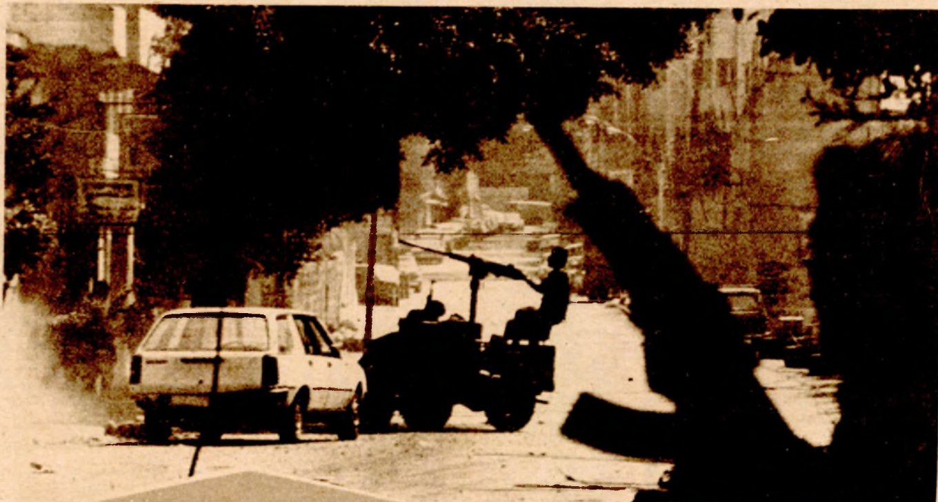
Свакодневна слика на улицама Бејрута

БЕЈРУТ, 17. априла (Танјуг) — Либански премијер Рашид Караме поднио је данас оставку владе у знак протеста послје крвавих битака на бејрутским улицама између ривалских муслиманских милиција.