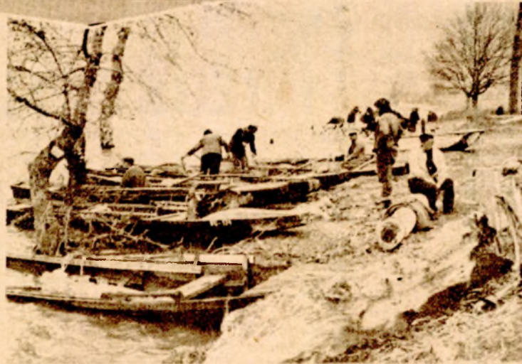
OBILJEŽEN DAN NARODNE TEHNIKE JUGOSLAVIJE