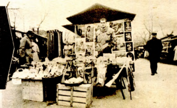
IZ KRKE U SVIJET