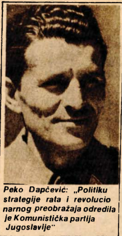
Peko Dapčević: „Politiku strategije rata i revolucionarnog preobražaja odredila je Komunistička partija Jugoslavije“

● Treba istaći naše opredjeljenje da na jugoslovenskom prostoru vodimo narodnooslobodilački-revolucionarni rat, a ne pokret otpora, da pobjedu izvojujemo vlastitim snagama, da stvorimo neophodne vojne i političke pretpostavke za prisvajanje vanje matici zemlji jugoslovenskih teritorija