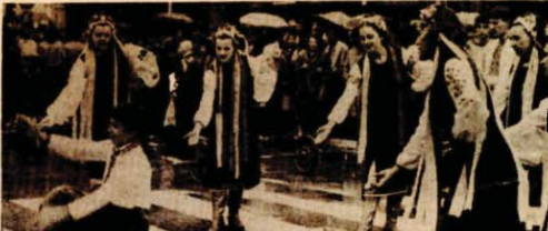
Da nije običan dan, svjedoči i ovaj nevakaidanji prizor u kojem je uhvaćen trenutak kad članovi KUD-a „Taras Ševčenko“ u čast Štafete izvoda svolu tačku nasrad ulice u centru Banjaluke