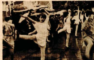
Nije parket nego obične daske mokre od kiše, ali kad se pleše srcem, onda se i na improvizovanoj bini može uspješno izvesti mala baletska tačka