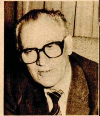
STRANE 2. I 3.

● Meni je, da vam pravo kažem, ova proslava četrdesetogodišnjice naše pobjede nad fašizmom tako prrsna, dobro je došla da se mi malo osvjestimo