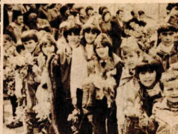
A najmlađi... Njihova su oči pune znatiželje. Strpljivo čekaju držeći u ručicama cvijeće kojim će na svojn način pozdraviti Štafetu