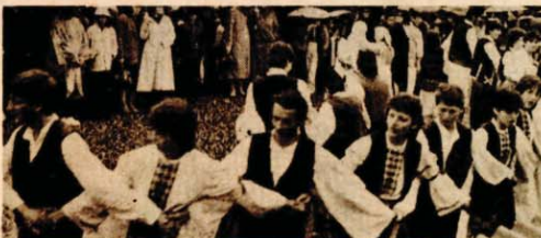
Ispraćujući Štafetu, u Čelincu se razvilo kozaračko kolo — Razigranoj mladosti nije smetalo ni proljetni pijusak.

Na putu od Kotor-Varoša do Banjaluke i od Banjaluke do Bosanske Dubice — svuda ispružene ruke, igra i pjesma, nezaboravni prizori koji će dugo ostati u sjećanju, jer juče je ovuda prošla Štafeta mladosti, dragocjen znamen u koji je preločena sva ljubav prema Titu, najdražem drugu i učitelju mlade generacije. N.S.F.