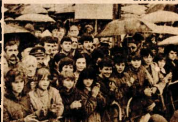
Kiša nije smetala: buran aplauz Štafeti i njenim nosiocima.