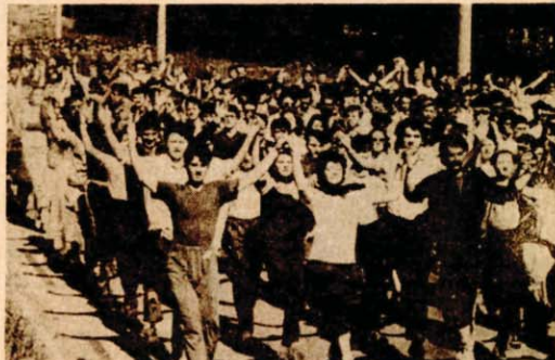
Sa probe četvrtog ešelona (šarenog), dan prije parade

● Svi učesnici parade su visokih moralno-političkih kvaliteta, odgovorni, poštrovovani i vrijedni i to dokazuje da dosljedno i puna srca ova generacija slijedi generacije koje su dale svoj doprinos učešćima u prethodnim paradama