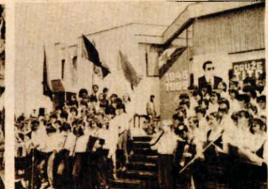
Još koji trenutak u Banjaluci! Štafeta već stiže u Lektše, gdje joj je dobrodošlicu požele dački hor i orkestar