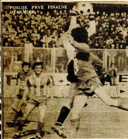
POSLIJE PRVE FINALNE UTAKMICE