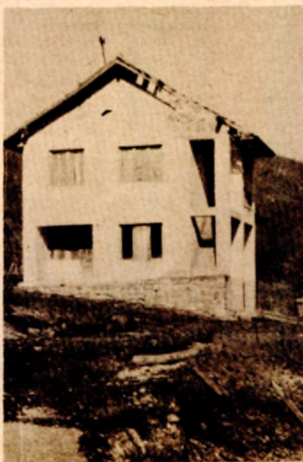
Napuštenu školu u Busijama biće sanirana

GORNJI RIBNIK, 13. maja — Skoro deceniju i po je prošlo kako je, u cilju racionalizacije školske mreže, na području ključke op-