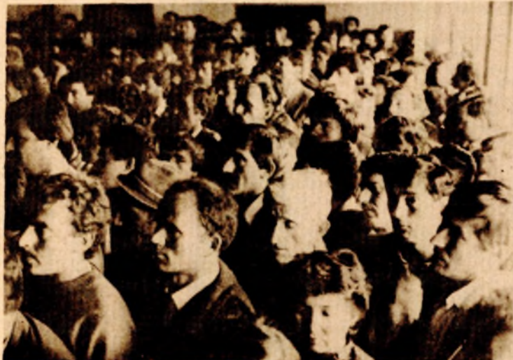
Više od pet stotina ljudi prisustvovalo je Zboru

Treći po redu zbor nakon ubistva devetnaestogodišnjeg mladića protekao je u istoj atmosferi kao i prethodni. Pljuštale su optužbe, paušalne ocjene, uvrede i prijetnje. Sasvim sigurno, mnoga pitanja se ne bi ni potegla da se ubistvo nije dogodilo. Ovako nemili događaj su pojedinci, očigledno, pokušali iskoristiti da baražnom vatrom drskih i neprovjerenih optužbi ospu organe Skupštine opštine Čelinaci ovdašnjeg SUP-a.