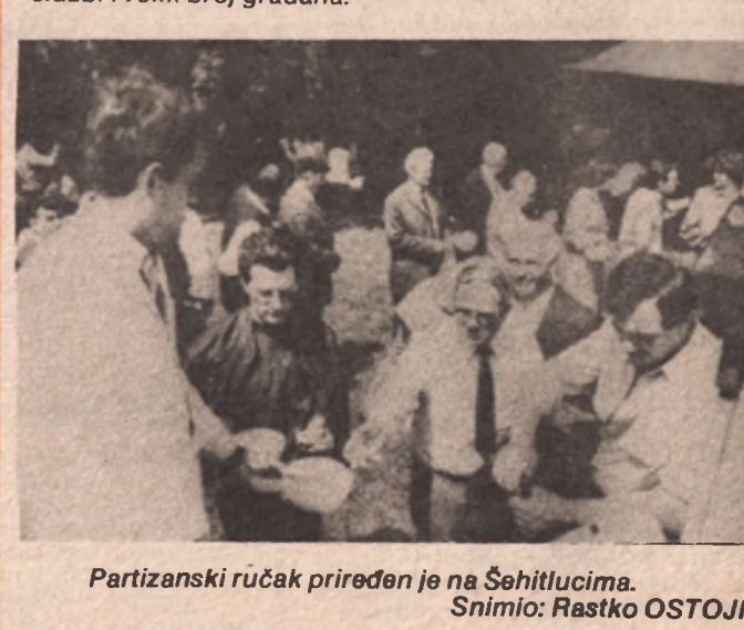
Partizanski ručak priredeni je na Šehitlucima.