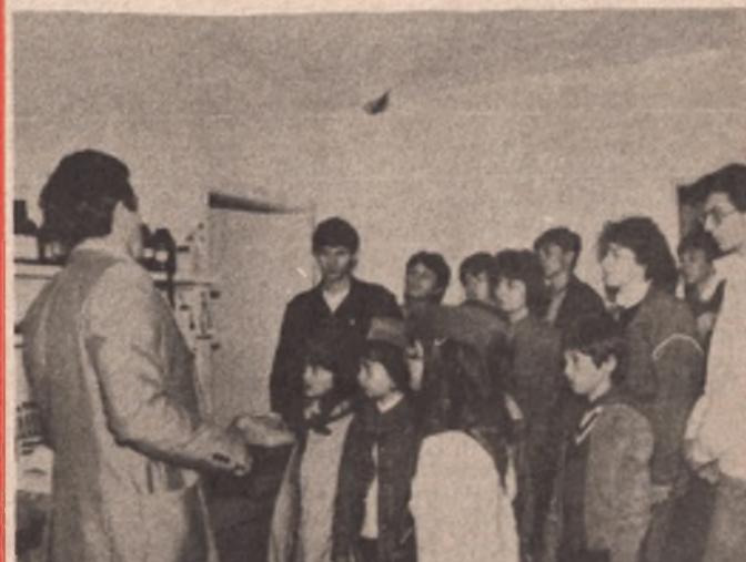
Banjalučki pioniri i omladinci posjetili su ovih dana Sekretarijat unutrašnjih poslova, interesovali se za rad i život pripadnika ove službe, te za način školovanja budućih pripadnika Službe bezbjednosti.