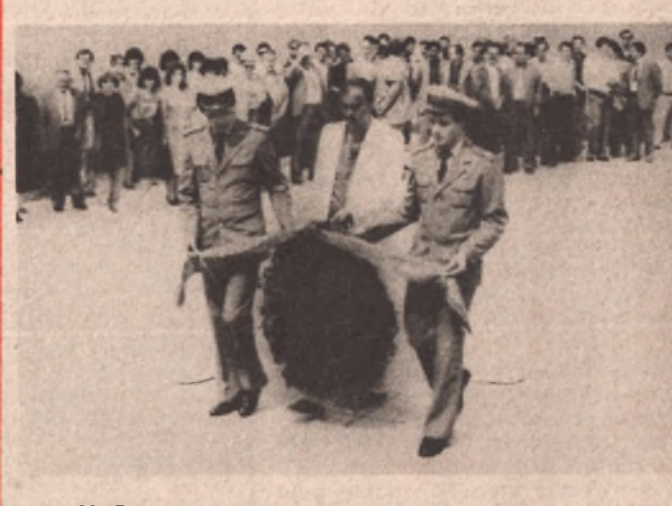
Na Spomenik palim Krajšnicima na Šehitlucima položen je vijenac. Ovom svečanom trenutku prisustvovali su radnici službi i velik broj građana.