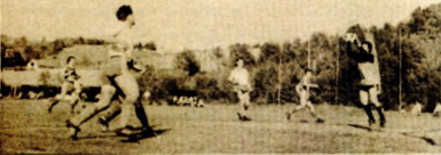
ATACI — Lider prvenstva uspio je da ostvari cilj i osvoji vrijedan bod. Međutim, mora se istaći da je u većem dijelu meča imao inicijativu, stvorivši više šansi za postizanje gola.