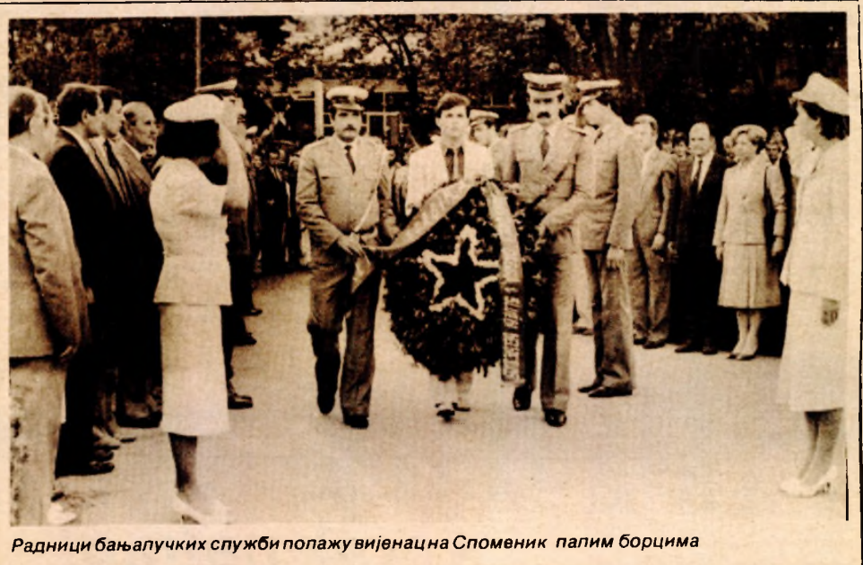
Радници бањалучких служби полажу вијенац на Споменик палим борцима