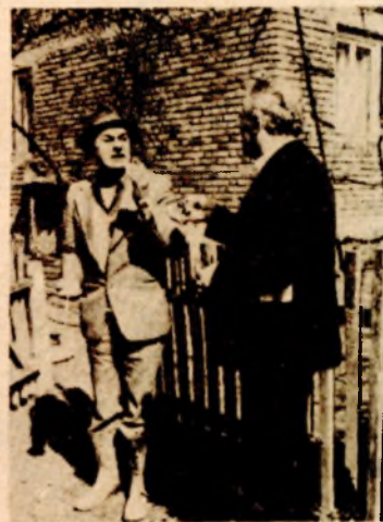
moji najbolji drugari, ali sam ih, na licu mjesta, svetio. Duša mi je plakala, ali nisam prestao da pucam.

— Neprijatelj nas je opkolio. Imao sam 250 metaka u ređeniku. Jedan za drugim padaju moji drugovi, a ja nemam kad da im pomognem. Za dlaku sam osto živ. Neprijatelj nije štedio municiju: kosio nas je. Pogiboše mnogi