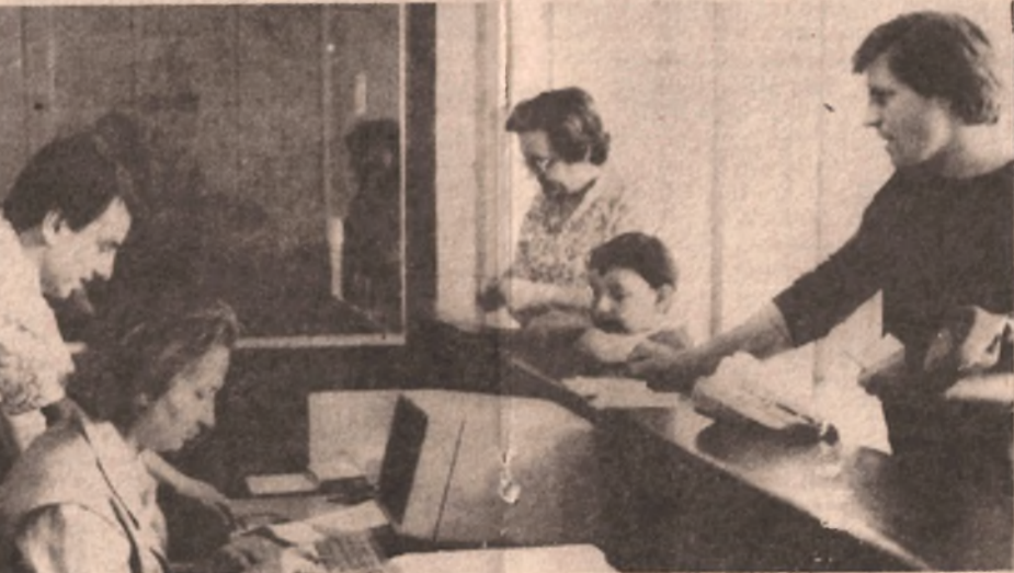
Renovirane prostorije ekspoziture PBS—Osnovne banke „Banjaluka“: više prostora za stranke