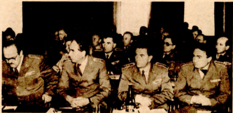
Sa današnjeg savjetovanja

Naravno, starješine JNA prvenstveno se osposobljavaju da znaju vrednovati kva-