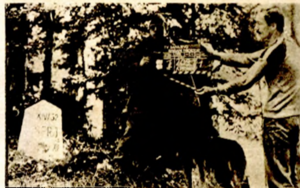
Scena iz TV - serije „Brisani prostor“

Gdje se god pojavljivala „vojska braće Andrić“, dočekivali su ih plotuni.