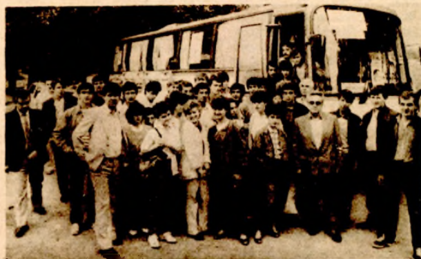
Ekipe Metalske škole pred polazak na put

BANJALUKA, 16. maja — Na tradicionalnom, 18. festivalu rada omladine Jugoslavije, koji sutra počinje u Skoplju, učestvovali će mladi Banjaluke što je predstavljaju učenici Metalske škole. Mladi Banjalučani će se takmičiti u 47 različitih zanimanja metalske i elektrostruke.