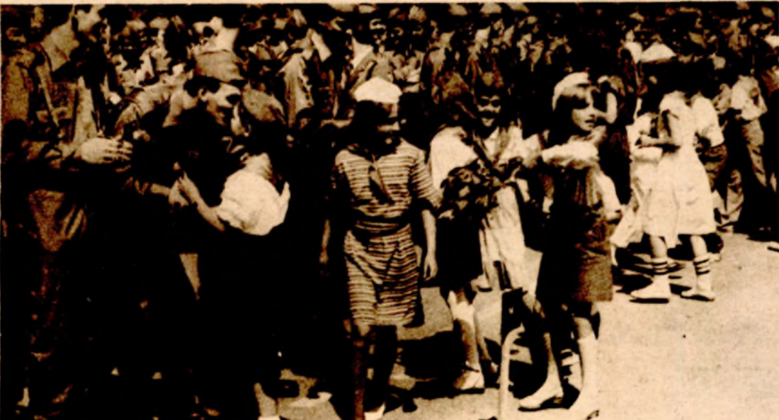
Прве честитке младим војницима - пољупцима и цвијећем - упутили су оањалучки пионери