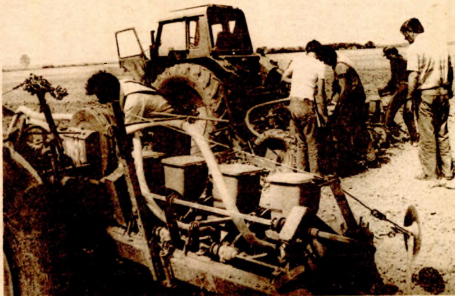
Sjetva traje od jutra do mraka

● Od planiranih 208.000 do sada je zasijano samo 143.423 hektara, od čega kukuruzom 48.459 hektara ● Nauka preporučuje da se sliju rani hibridi, a Institut Zemun polje poslao je pet tona hibrida „grupe 100“ da se besplatno podijeli poljoprivrednicima