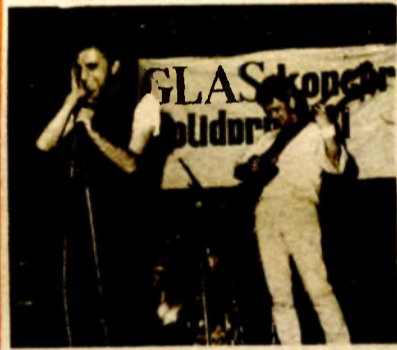
Banjalučka rok-grupa „Basdans“, učesnik u omladinskoj emisiji zagrebačke televizije

U večerašnjoj emisiji „Zdravo mladi“ pojavljuje se, između ostalih, banjalučka rok-grupa „Basdans“, nedavni učesnik na „Glasovom“ koncertu solidarnosti u „Boriku“. U seriju uspješnih nastupa (finalisti takmičenja „Nove nade“ u sarajevskoj „Skenderiji“, pojavljivanje na Sarajevskoj televiziji) ulazi i večerašnji u ovoj omladinskoj emisiji za koju su odabrali svoju pjesmu „Momci igraju“.