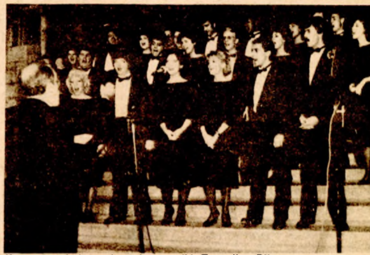
Koncert pod otvorenim nebom gosti iz Tenesija u Bihaću

BIHAĆ, 20. maja - Zahvaljujući naporima radnika SIZ-a kulture, prostor ispred ulaza u zgradu Skupštine opštine u Bihaću pretvoren je u svojevrsnu pozornicu, na kojoj u večernjim satima nastupaju horovi, KUD-ovi i razni orkestri. Ova novina u kulturnom životu grada naišla je na veliki odjek među posjetiocima, pa koncertima pod otvorenim nebom prisustvuje veliki broj posjetilaca.