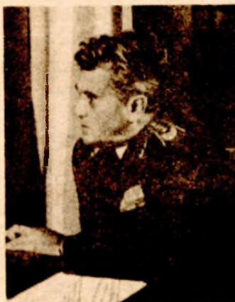
General-pukovnik Slobodan Alagić: Stručnost, entuzijazam, jedinstvo, vrhunska obučanost...

- Naša javnost već je obaviještena da je na redu superpersonični avion... Nije u pitanju samo nadzvučni borbeni avion, već cio sistem oružja vrhunskih rješenja i najnovijih tehnologija. Riječ je o borbenim sredstvima u koja će biti ugrađena vrhunska dostignuća tehničkih nauka. Naš program tehničke modernizacije treba da obezbijedi kvalitetan skok cijele naše nauke i tehnologije i njihovu integraciju, jer ne treba smetnuti sa uma da i danas više od sto radnih organizacija učestvuje u proizvodnji borbanih aviona i da je neophodno uključivanje novih proizvodnih i naučnih grana, osvajanje nekih specifičnih tehnologija itd. Mi smo uvjereni da će naš superpersonični borbeni avion predstavljati vrhunsko ostvarenje cijele zemlje i da će značajno podići naučni i tehnološki nivo, bez čega nema uspjeha ni u ekonomiji. Danas u naoružanju RV i PVO imamo oko 70 odsto borbanih i skoro sto odsto tehničkih sredstava koja su djelo naše