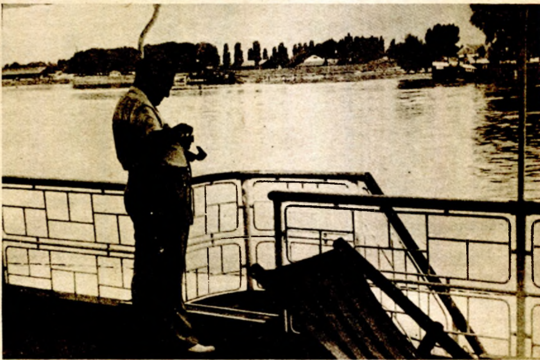
Drug Tito na brodu „Krajina“ na Dunavu prilikom putovanja u Novi Sad

Gotovo sva svjetska štampa pisala je o Titovoj posjeti Engleskoj i njegovom susretu a Čerčilom. Početkom januara 1953. godine Predsjednik se obratio Žeželju: „Čerčil me zove da posjetim Englesku. Ja sam poziv prihvatio i ti, Žeželju, počni da obavljaš pripreme za put“