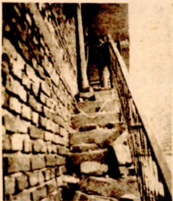
Jesenas sagrađena a sada nije sigurna za stanovanje: kuća u selu Derekare

U naseljima epicentralne zone mještani koriste lijepo vrijeme da poprave oštećene krovove, porušene dimnjake i ispucale zidove. Danas su pripadnici inženjerskih jedinica Prve i Druge armijske oblasti otpočeli radove na putu Blaževo-Mercéz. Izgradnjom ove dionice u dužini od 97 kilometara opština Brus i Kuršumlija dobiće najkraću saobraćajnu vezu. Nastavljeni su i radovi naputnim pravcima Brus - Sljivovo, Mramor-Derekare i Brzeće - Srebrnac.