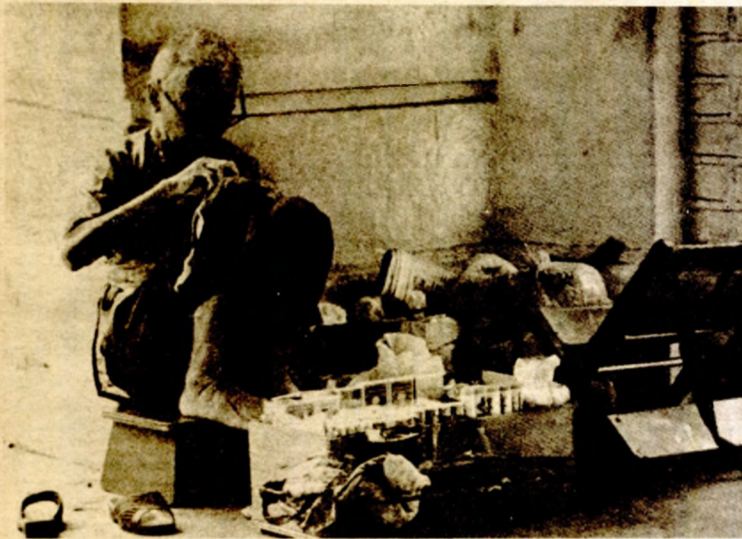
SINGAPUR, maja — Veliki dio stanovništva u Singapuru, koji se naglo razvija, živi u velikoj bijedi. Žena na slici nema problema sa stanodavcima: uz nju je sva njena imovina

koju lako nosi na leđima, na specijalnoj nosiljci. Daleka Azija vrvi od protivječnosti, a broj stanovnika čini da ih samo mali broj živi u bogatstvu.