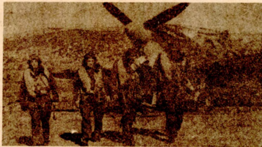
Piloti prve vazduhoplovne eskadrile: povratak sa borbenog zadatka

Od posade Prve vazduhoplovne baze u Benini je 22. aprila 1944. godine formirana Prva vazduhoplovna eskadrila NOVJ, te 1.