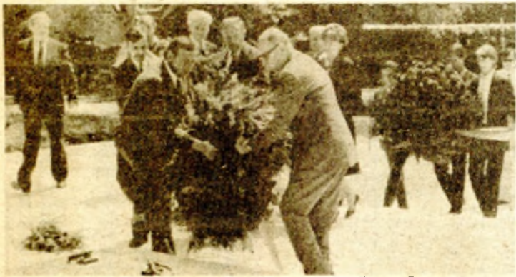
фото: О. АЛУЈЕВИЋ

ЗАГРЕБ, 22. маја (Фото Танјуг) - У поводу 43-годишњице смрти истакнутог револуционара, народног хероја Раде Кончара, на Гробницу народних хероја на Мирогоју, данас су положени вијенци и цвијеће. Вијенце су положили делегације ЦК СКХ са председником Председништва Миком Шпиљаком на челу делегације СоУР-а „Раде Кончар“, Општинског комитета СК Трешњевка и револуционарв брат Ђуро Кончар.