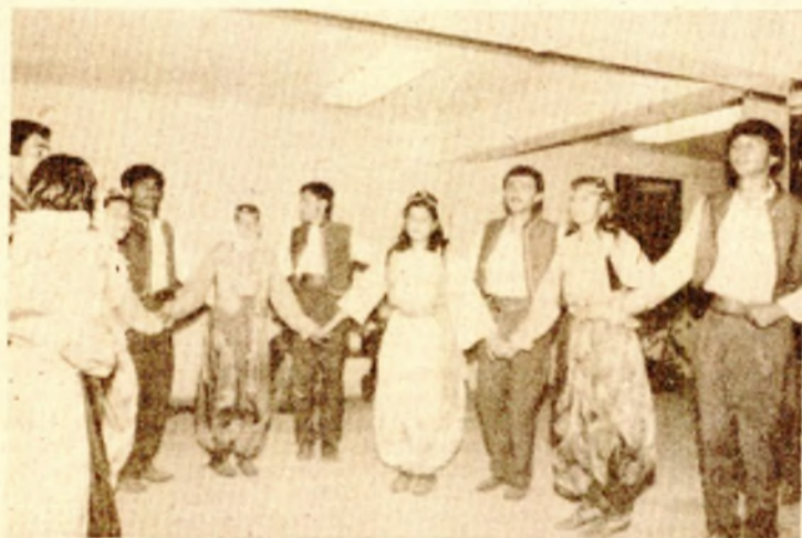
Članovi KUD-a „Veseli brijeg“ obećavaju uskovo nove susrete s pacijentima