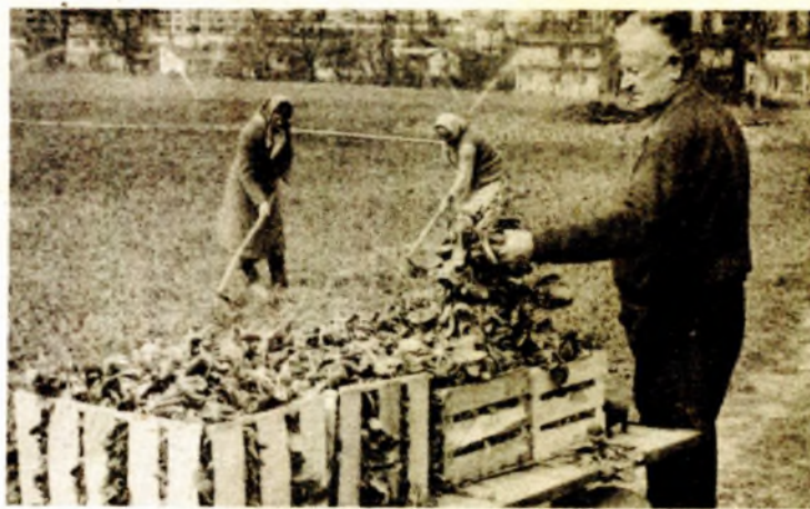
Povrće i na prigradskim parcelama