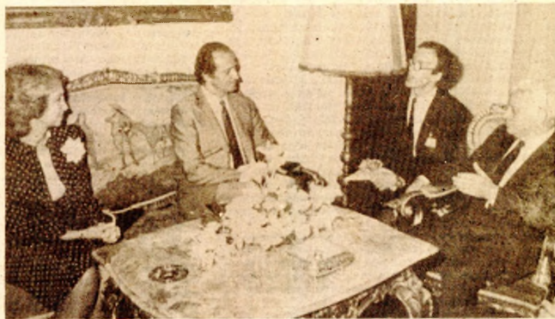
Španski kralj Huan Karlos Prvi, koji je u Beograd doputovao s kraljicom Sofijom, po dolasku je imao prve zvanične razgovore s predsjednikom Predsjedništva SFRJ Radovanom Vlačkovićem