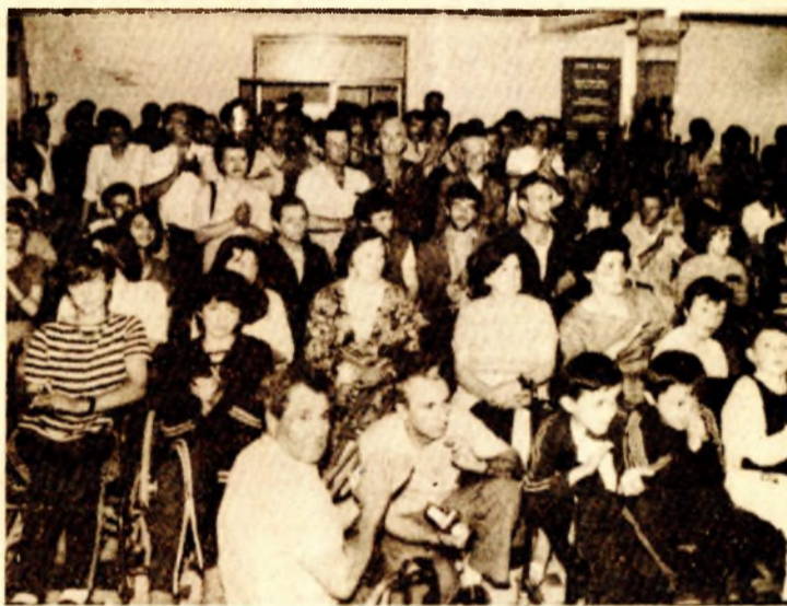
S velikom pažnjom pacijenti su pratili nastup folklornog ansambla