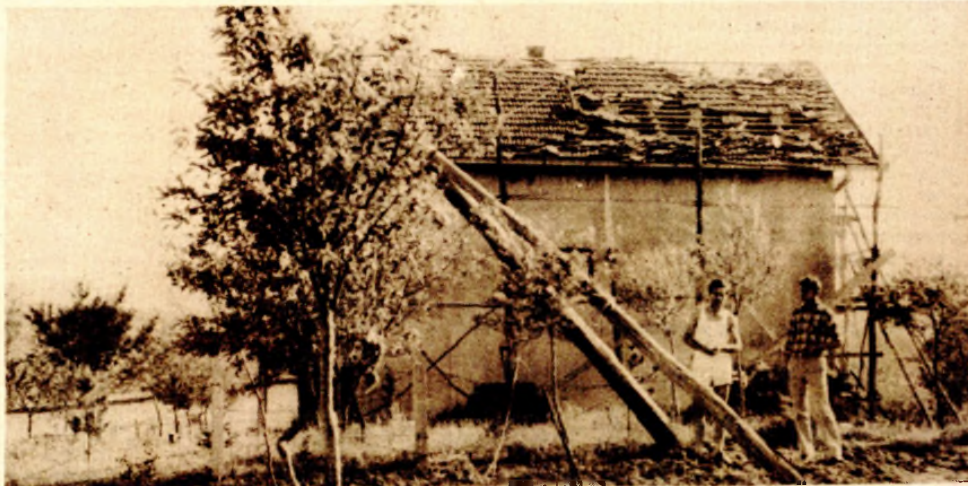
Šteta na kući Mirka Valentica je očigledna, a o žestini oluje svjedoči i polomljeni dalekovodni stub

su vodovi električne energije koja je, srećom, na vrijeme isključena. O štetama se još ništa pouzdano ne može govoriti. Štab civilne zaštite Mjesne zajednice Mišin Han