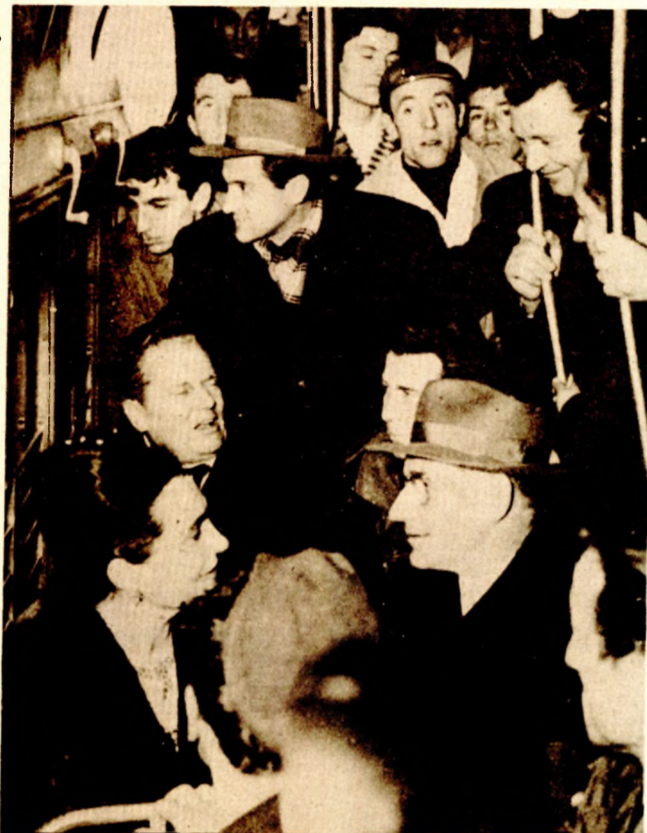
Uvijek s narodom: Tito u sarajevskom tramvaju poslije dočeka Nove 1962. godine