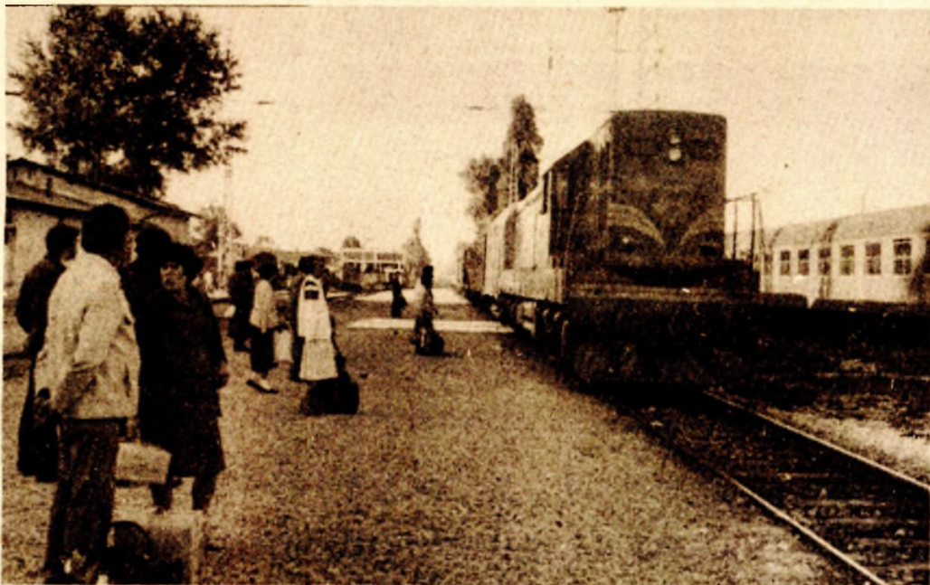
Izgradnja prema mogućnostima: Željeznička stanica u Banjaluci

U ovoj godini će, kako je utvrđeno i Realizacijom o društveno-ekonomskom razvoju opštine za 1985. godinu, početi sanacija, adaptacija i izgradnja željezničke stanice u Banjaluci. Svi prethodni poslovi oko obezbjeđenja uslova za realizaciju ove investicije već su usaglašeni između Izvršnog odbora Skupštine opštine i SOUR-a ŽTO Sarajevo, tako da preostaje da se delegati Skupštine opštine, na zajedničkoj sjednici sva tri vijeća, izjasne o Sporazumu o udruživanju sredstava.