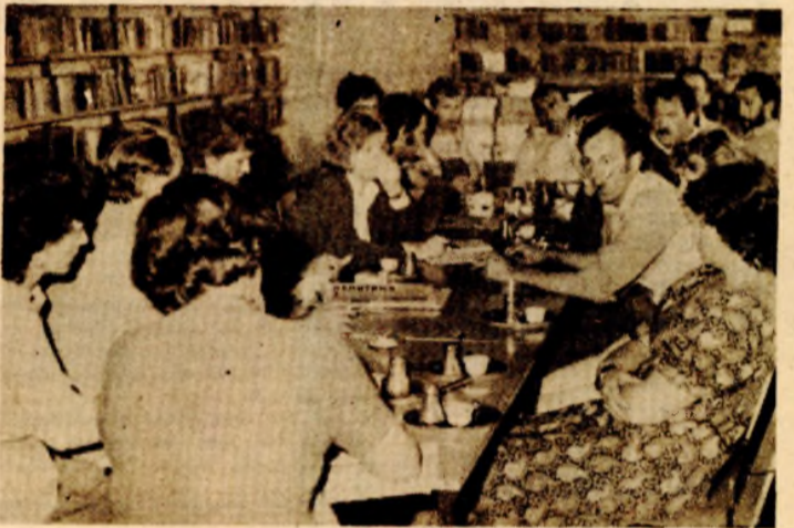
Okrugli sto: O naivnoj umjetnosti

- Aroma sela je u redu i već je izuzetno predstavljena, pa ne može biti pejorativno upotrebljena ni sama po sebi nekvalitetna (grunt i kravica). Mnogi naivni umjetnici