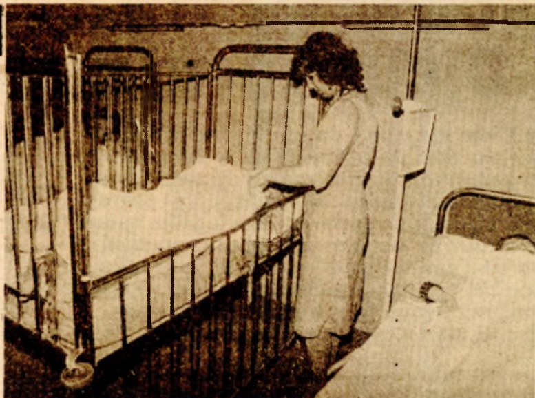
Pravovremena ljebarska intervencija: Poslije prve pomoći u prnjavorskom Domu zdravlja zatrovana djeca odmah upućena u Banjaluku i Derventu

● Trovanje, najvjerovatnije, prouzrokovao pokvaren sladoled iz slastičarne „Aroma“ ● Pritvoreni Muhedin i Nevzet Haliti a u gradu zatvorene sve četiri slastičarske radnje