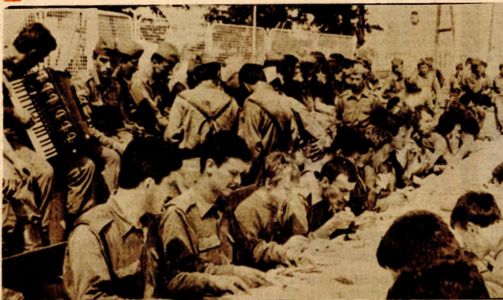
Послије напорног рада у „Слатексу“ је приврћен заједнички ручак

• Током јучерашњег дана положене су водоводне цијеве и затрпано око двије хиљаде метара канала • Акције неће престати док се водовод не заврши • Војници прискочили у помоћ омладини „Слатекса“