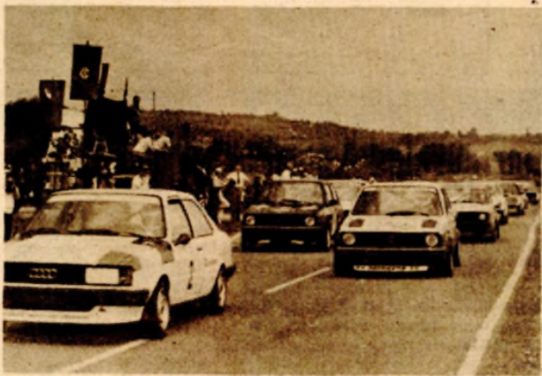
На старту трке на стази у Запужанима

ЈОШ ЈЕДНА АКЦИЈА У СЛАТИНИ, У ЛАКТАШКОЈ ОПШТИНИ