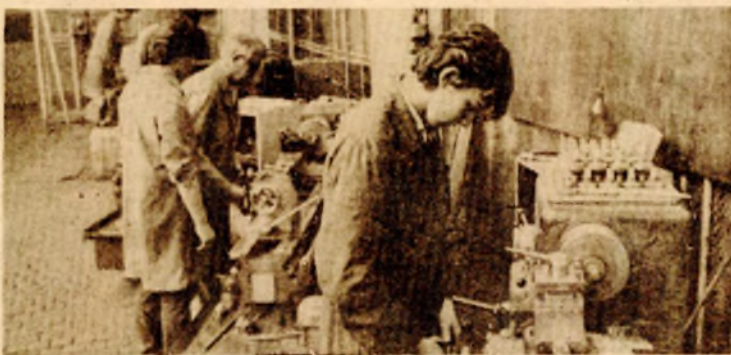
Praktična provjera znanja: radionica Metalske škole