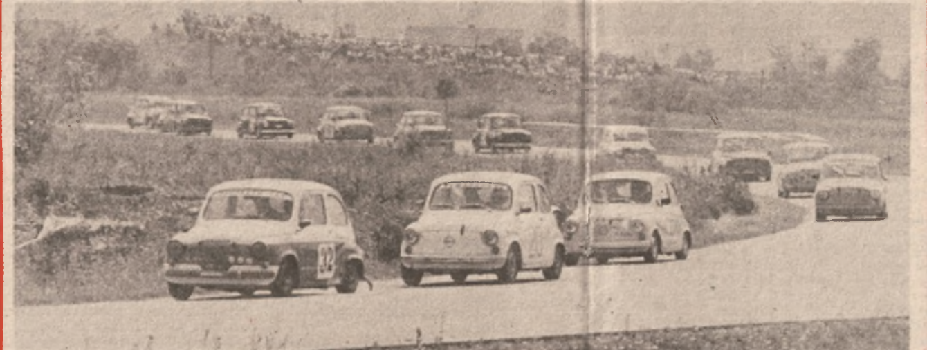
BANJALUČKA MONCA: Pista u Zalužanima, na kojoj je u nedjelju održana utrka koja se boduje za prvenstvo Jugoslavije, u automobilizmu, ponovo je položila ispit. Uz sve to bila je i odlična organizacija trke koju je sprovelo AMD „Krajina“ iz Banjaluke, uz saradnju sa „Jugo-autom“ iz Beograda.