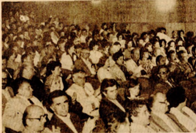
Prve večeri u Jajcu: Pred početak banjalučke predstave kojom su otvorene pozorišne igre BiH

Jednom riječju, konačna ocjena o banjalučkoj predstavi vidi