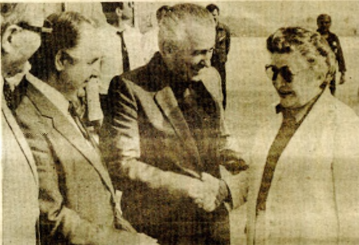
Sa dočeka na aerodromu „Zagreb“