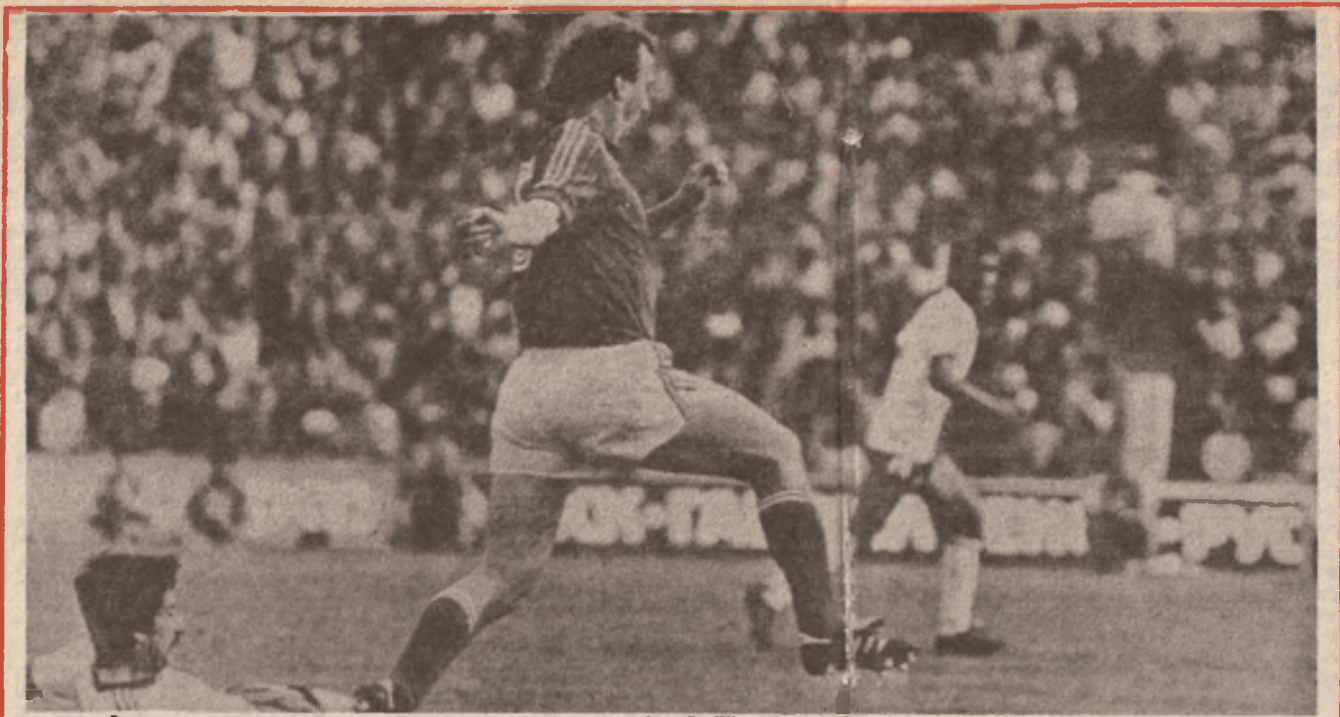
OPROŠTAJ: Fudbalska reprezentacija Jugoslavije poražena je u Sofiji od Bugarske sa 1:2 i tako se, najverovatnije, oprostila od Meksika. Jedan od prodora Zajeca, ka голу Bugara

MRKONJIĆ — GRAD — Ovgodišnji pobjednik tradicionalnog majskog turnira u malom fudbalu u Mrkonjiću-Gradu organizovanog povodom Dana mladosti i rođendana Društva Tita, ekipa iz Očune. Od 44 ekipe - učesnika u finalu su se sastale Podorugla i Očune. Regularni tok završen je rezultatom 2:2 a produžecima ekipa iz Očune je postigla i pobjedonosni gol te osvojila pehar i sportsku opremu, dar organizatora turnira OK SSO Mrkonjić-Grad. L. STUPAR