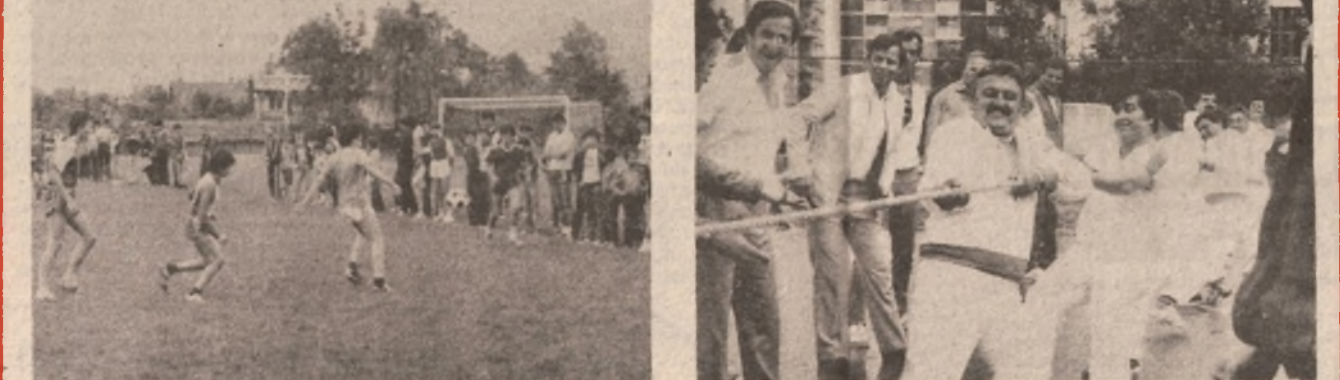
NAJMLADI NA OKUPU: Fudbalski klub BSK bio je organizator dvodnevnog pionirskog turnira na kojem su mladi pokazali dosta vještno.