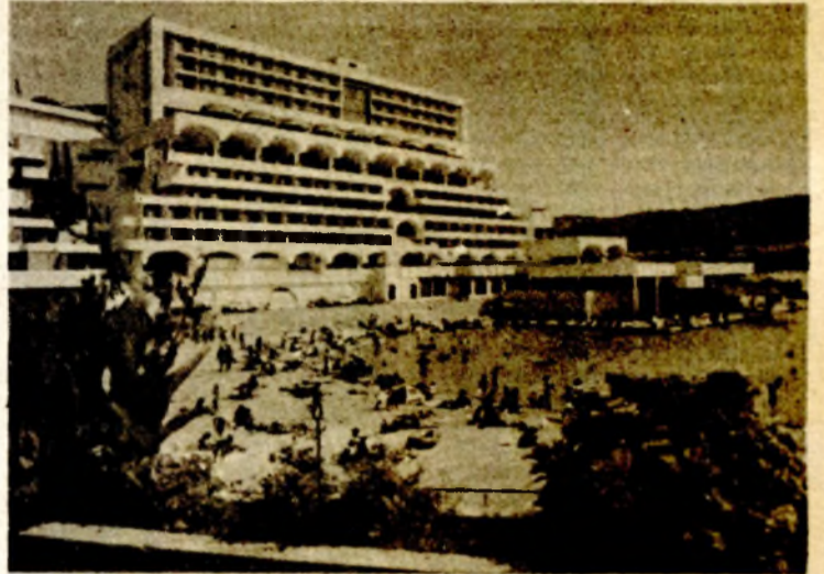
Neum: sve bolja turistička ponuda

● Cijene u hotelima su previsoke za domaći džep ● Ležaj na području Neuma kreće se od 250 do 550 dinara ● Silno je na Rivijeri Karđeljevo, a znatno je skuplje na Makarskoj, Splitskoj i Trogirskoj rivijeri