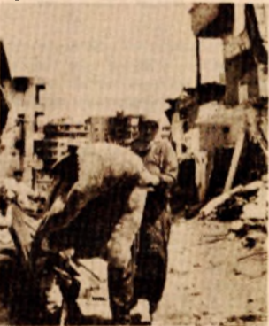
Posljedice svakodnevnih razaranja u logoru Sabra

Prijedlog PLO-a da se održi specijalna sjednica podržali Saudijska Arabija, Jordan, Irak, Katar, Maroko, Tunis, Alžir, Libijska Džamahirija i Sjeverni Jemen