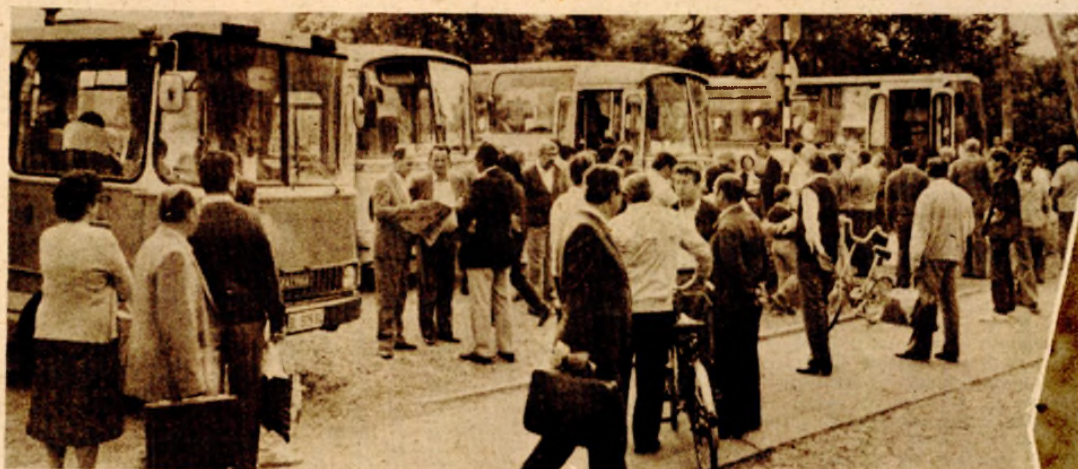
Karavan autobusa iz Banjaluka juče je krenuo prema Pelješcu

MJESEC DANA POSLIJE ODLUKE SIV-a O VRAĆANJU CIJENA NA STANJE IZ FEBRUARA