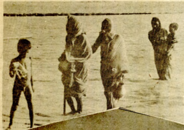
POSILIJE CIKLONA U BANGLADEŠU

Istoričari procjenjuju da novčići potiču iz perioda između 1354. i 1434. godine, to jest iz doba „crne smrti“ (kuge) koja je u 14. vijeku harala Evropom i „rata dviju ruža“ u 15. vijeku i da su najvrednije blago pronađeno u Velikoj Britaniji za posljednjih 25 godina.