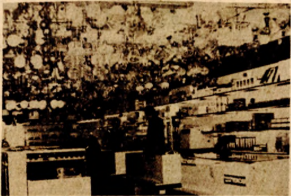
Dokle se stiglo sa vraćanjem na februarSKI cjenovnik: Robna kuća „Metal“

Odluku o vraćanju cijena na februarSKI nivo do sada su donekle „poštovali“ bosanskogradiška „Prehrana“, za tri proizvoda, „Hemik“ iz Kikinde, sarajevski „Astro“, zagrebački „Frank“, „kruševačka Merima“, ljubljanski