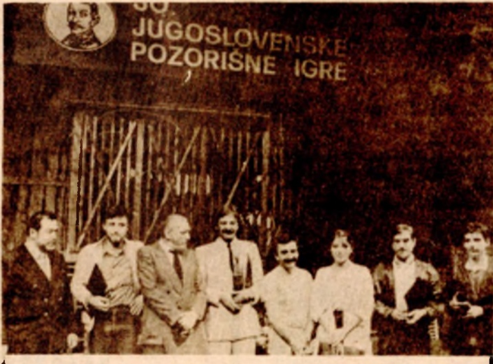
Sterijine nagrade u rukama najboljih

komisije donijeta je odluka kojom je najviše nagrada dobila predstava „Srećna nova 49“ Gordana Mihića u režiji Slobodana Unkovskog. Njenim izdavačima - makedonskom Narodnom teatru iz Skoplja, pripala je Sterijina nagrada za