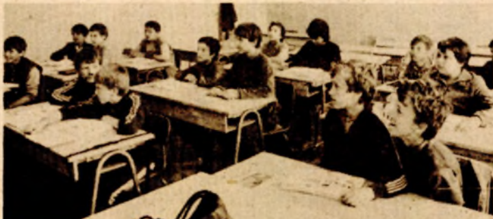
Dok je u prizemlju škole „Kasim Hadžić“ govoreno o „Pedagogu u školi“ u jednoj od učionica su daci V razreda kojima malo teže ide engleski jezik, imali čas produžne nastave

BANJALUKA, 11. juna - Mjesto pedagoga u školi i njegovo široko polje rada, bez dvoumljenja, je prihvaćeno i zakonski je predviđeno. Međutim, ostvarivanje njegove osnovne uloge u unapređenju i osavremenjavanju obrazovnog procesa ne ide baš uvijek lako, uglavnom zbog nedovoljno definisanog položaja ovog radnika u školama. Nerijetko, njihovo znanje i sprema se zanemaruju i ovi stručnjaci se koriste za niz čisto administrativnih poslova. A za podizanje kvaliteta obrazovnog procesa od neprocjenjive je važnosti veća integracija nastavnika i učenika, koja je posebno narušena stva-