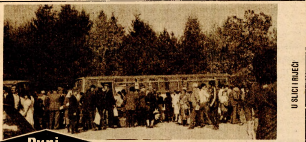
U SLICI RIJEČI

SAN HUAN — 11. juna — Oko 5000 Portorikanaca učestvovalo je na dvodnevnom protestnom maršu, tražeći povlačenje američkog atomskeg naoružanja sa Portorika i zaustavljanje trke u naoružanju. Pohod je završen skupom ispred američke vojne baze u Seibi, najveće na Karibima. Kako javlja Prensa Latina, naskupu je pročitana poruka bivšeg američkog predsjedničkog kandidata i borca za ljudska prava Džesija Džeksone u kojoj se kaže da su suverenitet i pravo naroda na samoodlučivanje tjesno povezani sa borbom protiv militarizacije i da je pretvaranje Kariba u zonu mira u interesu svih naroda. U poruci se dodaje da godišnji izdaci za naoružanje iznose već 700.000 miliona dolara, dok istovremeno 570 miliona ljudi u zemljama u razvoju gladuju, 800 miliona odraslih je nepismeno, a 1,5 milijardi ljudi je bez osnovne ljebarske njege. Džekson naglašava da je u većina stanovnika Sjedinjenih Američkih Država za zamrzavanje i smanjenje nuklearnog naoružanja.