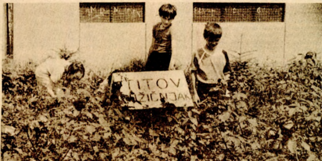
Mališani su ponosni na svoje dvorište

tnik plakete Socijalističkog saveza za očuvanje čovjekove okoline. — Sami proizvodimo živu ogradu i ruže, dio sadnica smo kupili, dio dobili i tako smo uredili ružičnjak i