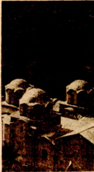
Pečka patrijaršija riznica kulturnih i istorijskih spomenika

Prirodne vrijednosti u Pokrajini su planine Šara, Prokletija i Mokra, te poznate banje Ilidža kod Peći, Banjska i Klokot banja. Brezovica i Dečani predstavljaju vazdušne banje u ovom kraju, a boraviti na Kosovu i ne vidjeti Rugovsku, Kačanicku i Ibarsku klisuru, te kanjone Miruše i Sušice, Pećine Radovačku i Mermernu pećinu Murtur, izvor Bijelog Drima, Irijeku Nerodimku, znači ne vidjeti prirodne bisere poznate u Evropi. Kanjon Miruše sa 16 riječnih jezera stepenasto postavljenih na dva kilometra, podsjećaju na Plitvička jezera.