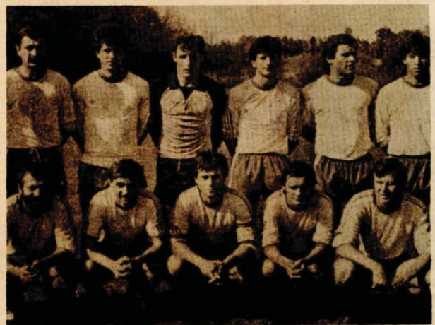
Fudbaleri Elektronske iz Jajca prvaci Regionalne lige u 1984/85. godini

IDUĆE KOLO: ZACIN: Krajlina - Lokomotiva (B) BOSANSKA GRADISKA: Kozara - Bratstvo, DOBOJ: Sloga - Krajišnik, ZAVIDOVIĆI: Krivaja - Rudar, BANOVICI: Budućnost - Borac (Č), HRASNICA: Famos - Bosna, VITEZ: Vitez - Lokomotiva (M), TRAVNIK: Borac - Drina.