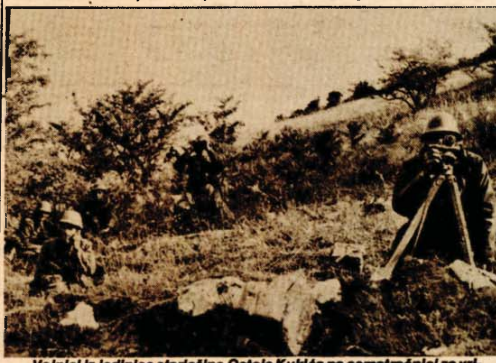
Vojnici iz jedinice starješine Ostoje Kuklića na ocmatračnici za vrijeme bojevog gađanja