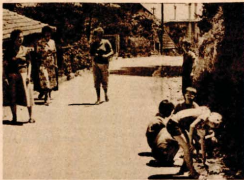
Igre u ovim ulicama vode često u bolnicu

● Zato što se ne mogu priključiti na kanalizacionu mrežu stanovnici grade septičke jame ● Ulicom teku otpadne vode i prijete zarazom ● Potok Močila — kanalizacioni odvod ● Investicija pozamašna, a para niotkud