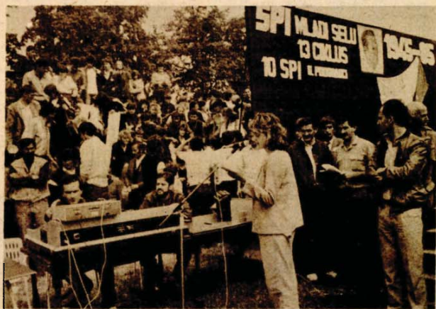
До виђења идућег јуна: завршна свечаност у Горњим Подградцима

ГОРЊИ ПОДГРАДЦИ, 16. јуна - Данас су у Горњим Подградцима завршене јубиларне 10. сеоске партизанске игре Босне и Херцеговине. На овој традиционалној спортој манифестацији учествовало је више од 800 девојака и младића из 63 општине из наше републике.