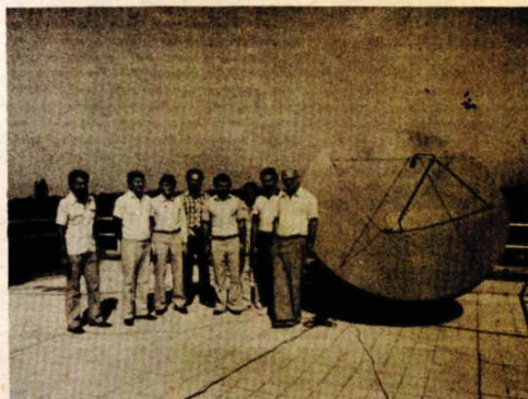
Evropski TV-program „Eurikon“ V i ekipa Jugoslovenske radio-televizije koja je ostvarila ovaj eksperiment

U pogledu nastavka eksperimenata, učešćem u difuznom eksperimentu putem satelita