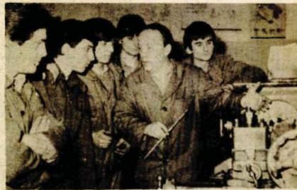
Učenici na praksi

PRNJAVOR, 16. juna — Ovih dana još jedna generacija polaznika Centra za srednje usmjereno obrazovanje i vaspitanje „Rada Vranješević“ završila je školovanje.