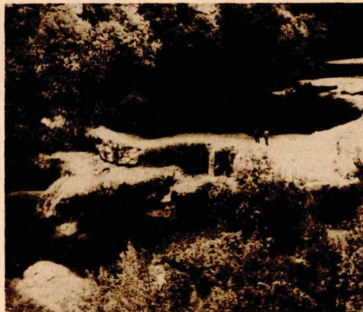
Čuvana ljepota Plitvičkih jezera, ali i sve drugo što je nužno gostu

sva mjesta popunjena, a slično je i u ostalim ugostiteljskim objektima uz jezera. Mjesta jedino ima u hotelima, motelima i kampovima udaljenim desetak kilometara.