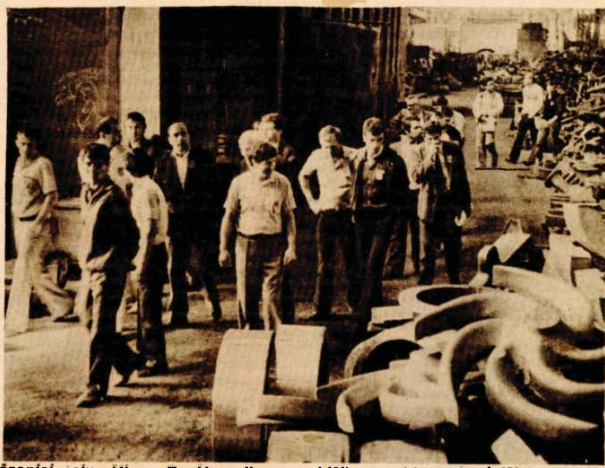
Učesnici skupštine Društva livaca obišli su Livnicu „Jelšingrad“

● Na godišnjoj skupštini Društva livaca rečeno da u livarstvu u Republici radi 1.400 nekvalifikovanih radnika što je ocijenjeno kao nepovoljna kvalifikaciona struktura, jer je to petina od ukupno zaposlenih