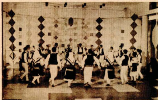
Ansambl KUD-a „Karlo Rojc“ stižu pozivi

● Amateri „Karla Rojca“ putovali 3600 kilometara da bi se predstavili igrom i pjesmom u Holandiji i SR Njemačkoj ● Za osam dana deset nastupa ● U novembru nastup u Nirnberškoj operi.