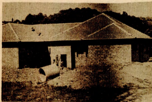
Društveni dom u Prijakovcima - za završetak neophodno još novca

Da bi se dom konačno mogao završiti, trebao je još dosta para i rada, jer projekt koji je uradio beogradski „Projekt“, prema cijenama iz 1981. godine predviđa vrijednost investicije oko deset miliona dinara. Stoga ovdje i očekuju pomoć od društvene zajednice, koja nije izostajala ni u ranijim seoskim akcijama, a namjeravaju da neke prostorije izdaju pod zakup. Rekoše da im je neophodna prodavnica i ugostiteljski objekat, a zakupljivači bi imali obavezu da uredi prostorije,