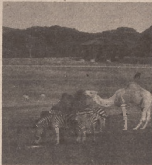
Safari park - Jedna od većih atrakcija

Od prvog aprila prošle godine, otkako je konstituisana Radna organizacija Nacionalni park „Brioni“ (u osnivanju), pa do kraja 1984. ovo područje posjetilo je 112.000 turista. Broj gostiju je u stalnom porastu, tako da danas na Brione dnevno dolazi u prosjeku 1.000 ljudi.