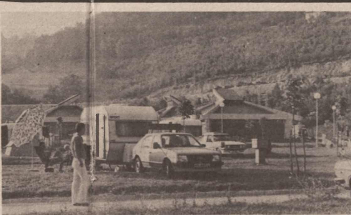
Auto-kamp „Pelve“ na Plivskim jezerima