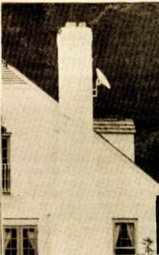
Parabolična antena: Nova tehnološka rješenja za prijem kosmičke televizije

Prvi eho rimskog sastanka iz januara ove godine mogao se čuti i uočiti na nedavno završenom 36. međunarod-