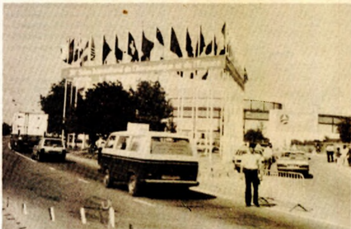
Na 36. međunarodnom salonu aeronautike i kosmosa bilo je više od hiljadu izlagača iz 33 zemlje, među kojima i iz Jugoslavije („orao“ i „supergaleb“)

Čini nam se da je pravo vrijeme da se sve zaintereso-