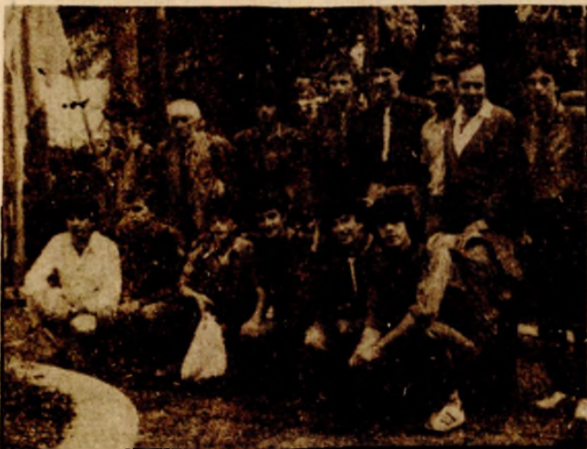
Izviđači Odreda „Vid Nježić“ prilikom nedavnog pohoda do Kuća cvijeća

ZAPAŽENA AKTIVNOST PRNJAVORSKIH IZVIĐAČKIH ORGANIZACIJA