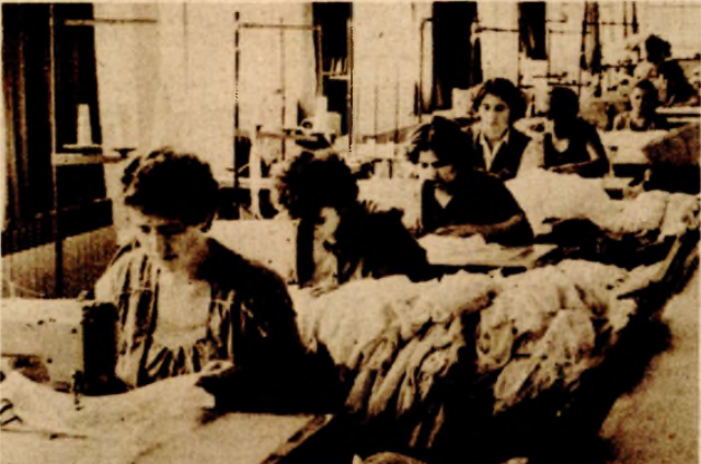
Osigurana devetomjesečna proizvodnja: gotovinom plaćene uvozne, visokoproduktivne mašine i oprema

ZAHVALJUJUĆI MODERNIJOJ PROIZVODNJI U BOSANSKONOVSKOJ „SANI“