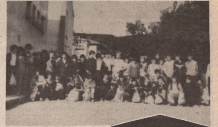
Osnovcima će ekskurzije ostati u nezaboravnoj uspomeni