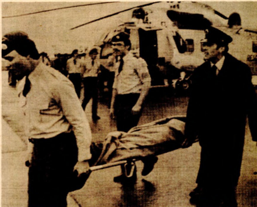
Број жртава из часа у час расте: