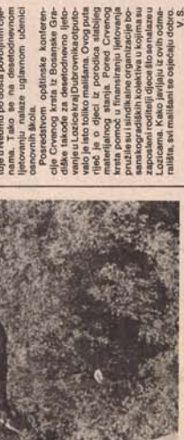
GLAS, str. 2, juli 1985.

U organizaciji SŽ-a i Centra za turizam u Neumu i Lozicama. U organizaciji SŽ-a i Centra za turizam u Neumu i Lozicama.