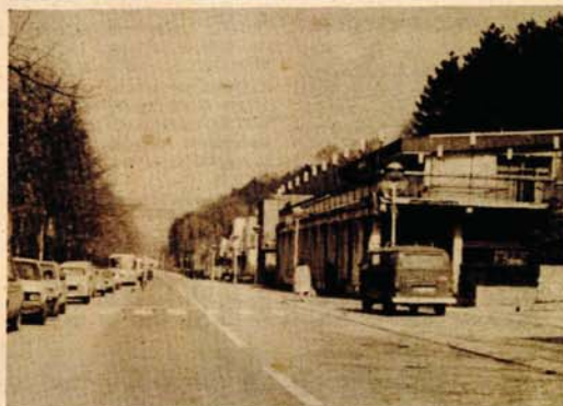
Stambeni fond Kotor-Varoša bogatiji za 36 stanova

KOTOR-VAROŠ, 1. jula - Uskoro će u Kotor-Varošu biti završena izgradnja nove stambene zgrade sa 36 stanova. Tako se nastavlja uspješna realizacija stambene izgradnje u ovoj opštini. U planu je ove godine da počne izgradnja još jednog objekta sa 30 stanova. Uoporedo sa društvenom uspješno se realizuje i individualna izgradnja. U proteklom periodu ove godine izdano je oko stotinu odobrenja za izgradnju individualnih objekata. Radi brže stambene izgradnje ugovorena je izrada urbanističkih planova mjesnih zajednica. U toku je aktivnost i na izmjenama urbanističkog plana grada. D. K.