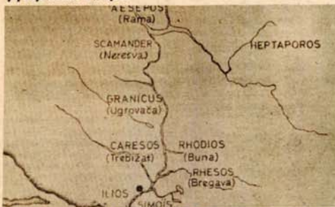
Salinasova šema po kojoj se vidi da je Neretva zapravo rijeka iz drevnog trojanskog carstva

● Menderes, rijeka u Maloj Aziji, na čijim je obalama daleke 1870. godine Hajnrih Šliman otkrio Troju, nema onih osobina koje joj daje Homer u „Ilijadi“