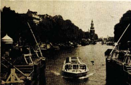
I treptaj znači da se nešto propusti i ne vidi

stanovnika, snabdijeva pitkom vodom iz velikih rezervoara koji su izgrađeni ispod rijeke Amstel.