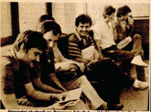
Vanredni studenti na Pravnom fakultetu u iščekivanju ispita iz krivičnog prava

ZAVRŠEN RAD JUGOSLOVENSKE LIKOVNO-EKOLOŠKE KOLONIJE „BARDAČA — SRBAC 85“