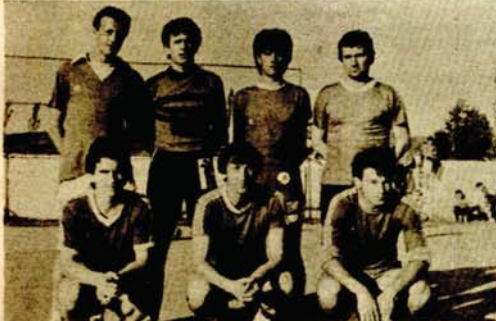
Pobjednički sastav "ČEVAPIMA"