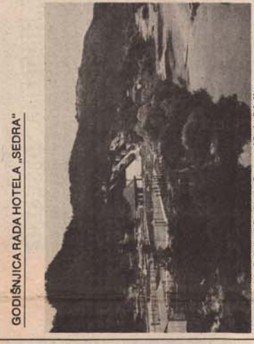
GODIŠNJICA RADA HOTELA „SEDRRA“

Zamboni je najveće rijeka u južnoj Africi. Zamboni je najveće rijeka u južnoj Africi. Zamboni je najveće rijeka u južnoj Africi.