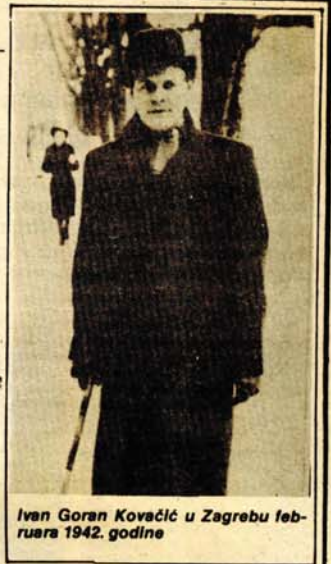
Ivan Goran Kovačić u Zagrebu februara 1942. godine

Duševni i duhovnu hranu u tim danima ratnog vremena predstavljalo je češće sastajanje sa Nazorom, koji je u dnu svoga srca krio nezalaganje sa onima što ustaše čine. U Goranu je imao vjernog savjetnika, kome se moglo reći sve ono što pritiska dušu. Izrazi nezadovoljstva kod Gorana su bili izraziti, da je stari Nazor, u časovima iskrenog ispovijedanja, morao svoga proverenog prijatelja da opominje na opreznost: