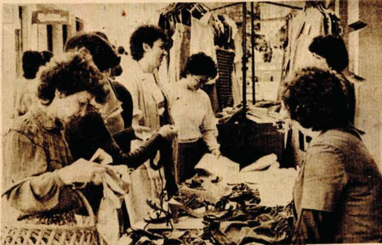
Pokretne tezghe na ulici privlače veliki broj kupaca, pogotovo što je i roba jeftinija

Što je skupo mora biti i kvalitetno. Ovo staro trgovačko pravilo odavno je napušteno, a pogotovo ne vrijedi otkako su cijene izmakle svakoj kontroli. Trgovci povremeno velikim rasprodajama mame kupce i nude im sve ono što na drugi način ne može iz skladišta. Na štandovima za rasprodaju nađe se svega i svačega, od krpice do cipelice i to po vrlo povoljnim cijenama za potrošače.