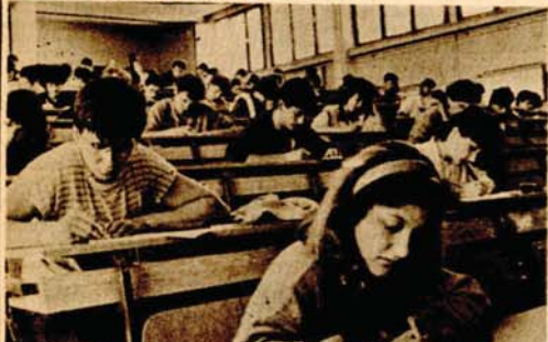
Polaganje prijemnog ispita iz marksizma budućih studenata Ekonomskog fakulteta