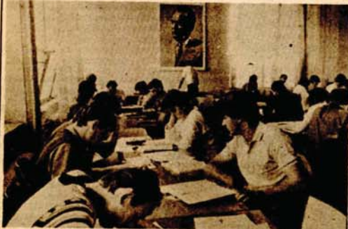
Učionica Studentskog doma „Veljko Vlahović“ još uvijek je prepuna

U amfiteatru Pravnog fakulteta u srijedu 26 juna prijavljeni kandidati za upis na prvu godinu Ekonomskog fakulteta polagali su prijemni ispit iz poznavanja marksizma. I ovog puta interes za upis na Ekonomski i Pravni fakultet su daleko veći od predviđenog broja studenata. Samo na Pravnom fakultetu, koji prima 100 radovnih i 80 vanrednih studenata, prijavilo se 413 kandidata. D. CRNIĆ-BABIĆ