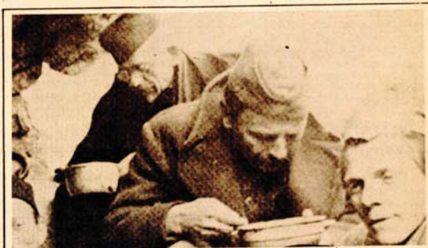
Jedna od posljednjih fotografija s likom I.G. Kovčića (prvi zdesna)

Imao je Goran mjesta i za ćelije. To je bilo 20. marta 1943. godine, kada je grupa okorjelih neprijatelja ostala pred cijepljenjem partizanskih pušaka.