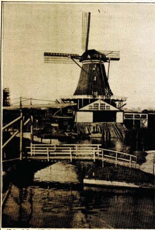
Vjetrenjača - obilježje i neprolazna ljepota holandskog pejzaža

Poslije nastupa u domovima staraca, „Karlo Rojca“ igra i na tradicionalnoj trgovini starina u Rodevoldu, predgrađu Rodena, pred „MOLENOM“. To je jedna od najstarijih vjetrenjača. Potiče iz 1852. godine. Melje žito i laneno ulje. Ova, kao i druge vjetrenjače je pod patronatom opštine. Služi kao atrakcija, a mnogo više košta nego što od nje ima zarade. Tu je i naša njegova.