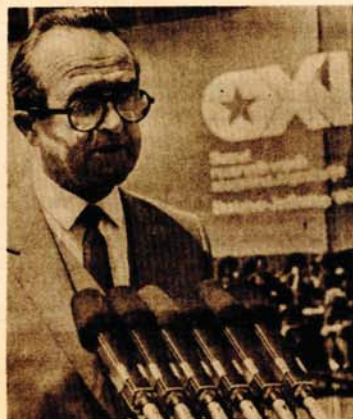
Великом збору присуствовали су и преживјели борци—игманског марша, а говорио је Бранко Микулић, члан Председништва СФРЈ

Свима мора да буде јасно—нагласио је Бранко Микулић да ће сваки наш гранични стуб, без обзира о којој је граници ријеч, сложено као један бранити сви Југословени.