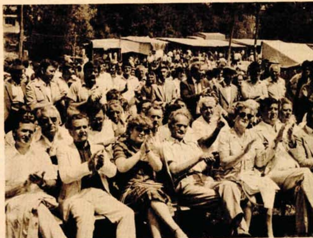
Deseto sretanje delegacija bratskih mjesnih zajednica Jugoslavije