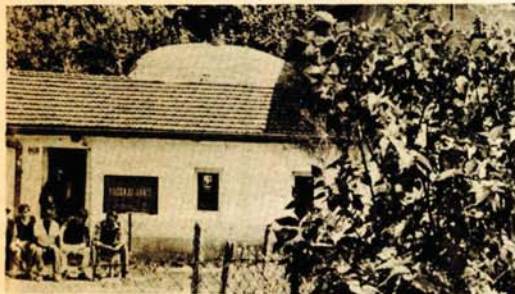
Posjetiloci banja u Gornjem šeheru — čekaju red za banjanje

● Dnevno banje u Šeheru posjeti oko sto gostiju, koji dolaze iz svih naših krajeva, pa čak i inostranstva