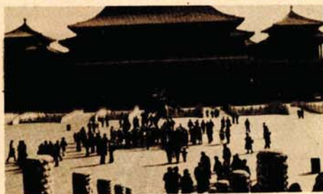
Zimski carski dvorac u Bejdinu (Peking)