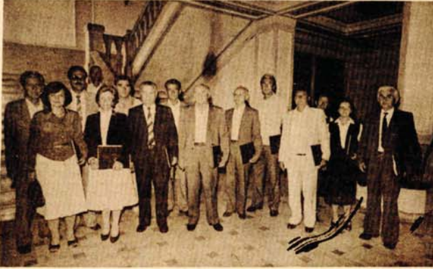
Dobitnici priznanja Opštinske konferencije Socijalističkog saveza Banjaluka

Nastavljajući svijetle tradicije Narodnog fronta i okupljajući u proteklih 40 godina sve napredne subjektivne snage, udružene u razvoj socijalističkih samoupravnih odnosa, Socijalistički savez radnog naroda bio je i ostao najjača snaga, sa Savezom komunista na čelu, koja odražava najširi krug interesa radnih ljudi i građana.