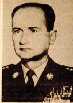
Vojčeh Jaruzelski: „Uvažavamo i ciljeno aktivnost bratske Jugoslavije u pokretu nesvrstanih zemalja“

● Stvaramo novu, proširenu formulu sporazumijevanja svih partijskih snaga naroda, koje priznaju ustavna načela socijalističke države. Patriotski pokret nacionalnog preporoda okuplja raznorodne snage društva. U pokretu učestvuju, na primjer, istovremeno komunisti i aktivisti katoličkih organizacija. Pron je već istupio sa novim važnim građanskim inicijativama, utvrdio je, između ostalog, platformu zajedničkog rada na programu izbora za Sejm. Sve veći značaj u našoj zemlji imaju sindikati. Ojačale su njihove organizacione strukture, saznali su novi aktivisti. Sve najbitnije odluke u privredi prethodno se konsultuju sa sindikatima, nastojimo da prihvatimo njegove sugestije. Za vladu je to veoma ozbiljan — mada priznajem, često težak partner u diskusijama o društvenoj politici, pogotovo u oblasti ličnih dohodaka i cijena. Jedan od ključnih elemenata u izgradnji nacionalnog sporazumijevanja je stalni, mada nimalo lak, dijalog sa Rimokatoličkom crkvom, koja u Poljskoj okuplja ogromnu većinu vjernika. Mišljenja smo da pravilna saradnja socijalističke države sa crkvom i vjerskim zajednicama može biti korisna za zemlju. Međutim, reagovaćemo na odgovarajući način na pokušaje da se crkva koristi za ciljeve koji nemaju ništa zajedničko sa njenom pastirskom misijom. Poljska je zemlja vjerskih sloboda i pogleda na svijet. Ipak, ta se načela moraju uvažavati