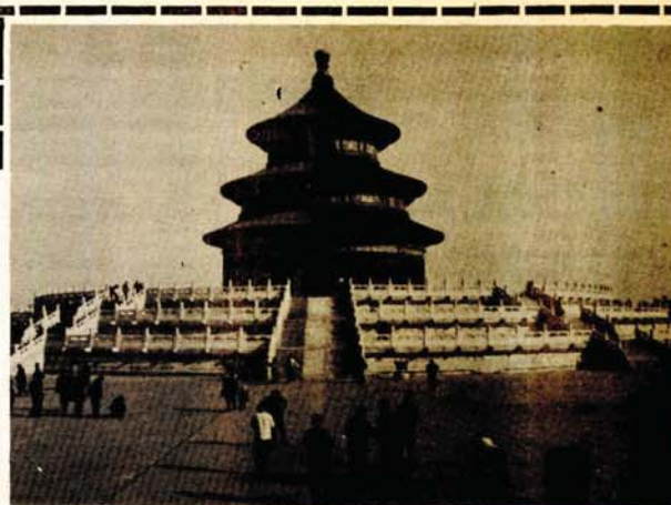
Tjan tan (Hram neba) u Bejđinu (Pekingu)

Na drevnom istoku postoji jedan zmaj čije je ime Kina — kaže muzičar sa Tajvana Ho Dađen u popularnoj kineskoj pje-