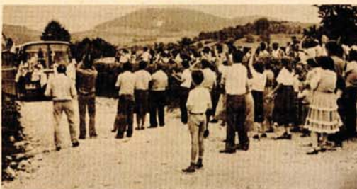
Prvi autobus, pun brigadista, stiže u selo Melina