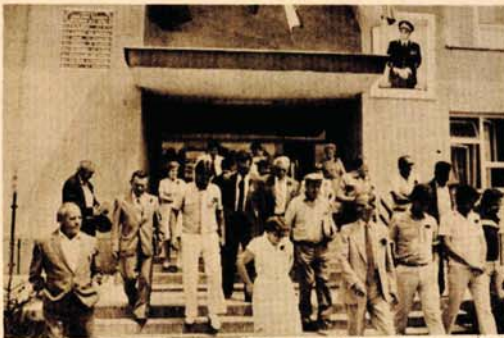
Delegati bratskih mjesnih zajednica Jugoslavije nakon susreta i razgovora o finansiranju i opsluživanju mjesnih zajednica

●U sklopu obilježavanja Dana borca i Desetih, jubilarnih, susreta bratskih mjesnih zajednica Jugoslavije otvoren put i autobuska linija Bronzani Majdan - Melina